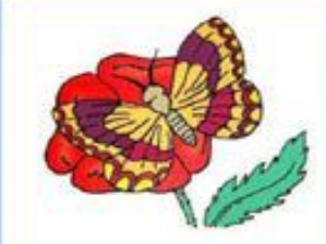
бабочка сидит на цветке