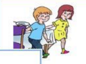
на и из-за стола