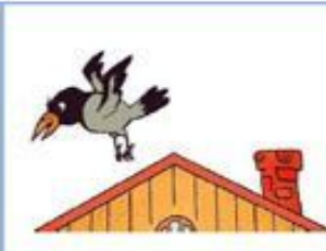
ворона летит над крышей