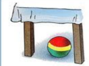
мяч закатился под стол