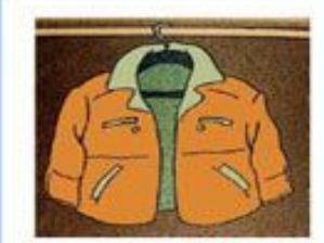
куртка висит на вешалке