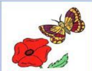
бабочка летает над цветком