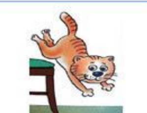
кошка прыгает со стула