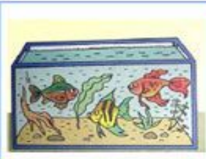
рыбки плавают в аквариуме