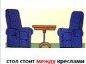
стол стоит между креслами