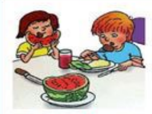
дети сидят за столом