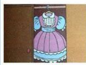
платье висит в шкафу