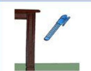
ручка падает со стола