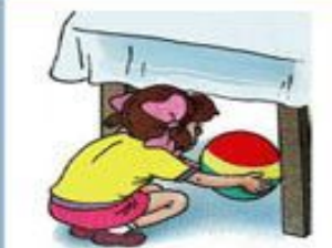
девочка достает мяч из-под стола