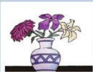
цветы стоят в вазе