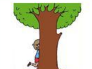
мальчик спрятался за дерево