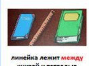
линейка лежит между книгой и тетрадью