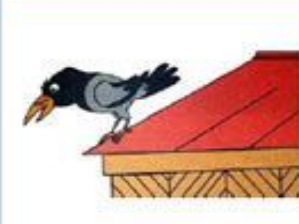
ворона сидит на крыше