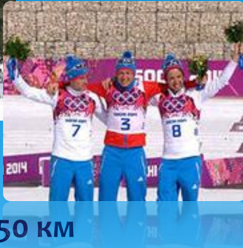
Масс-старт 50 км