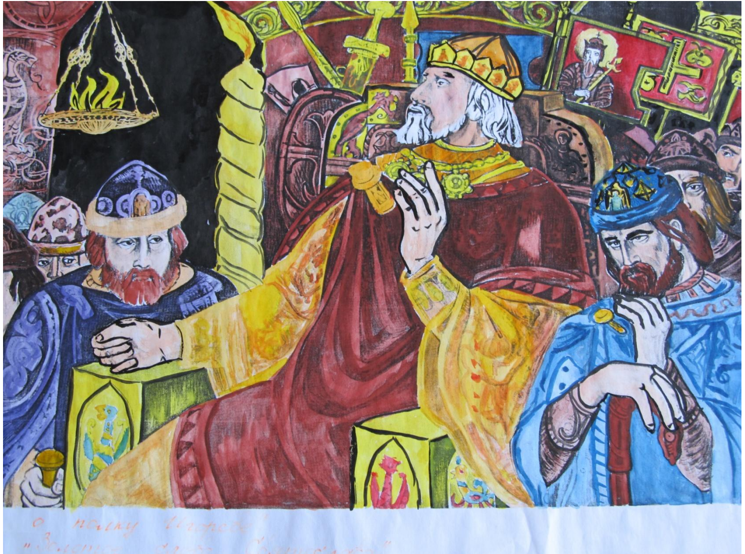
«Золотое слово Святослава» Автор: Приходченко Влад