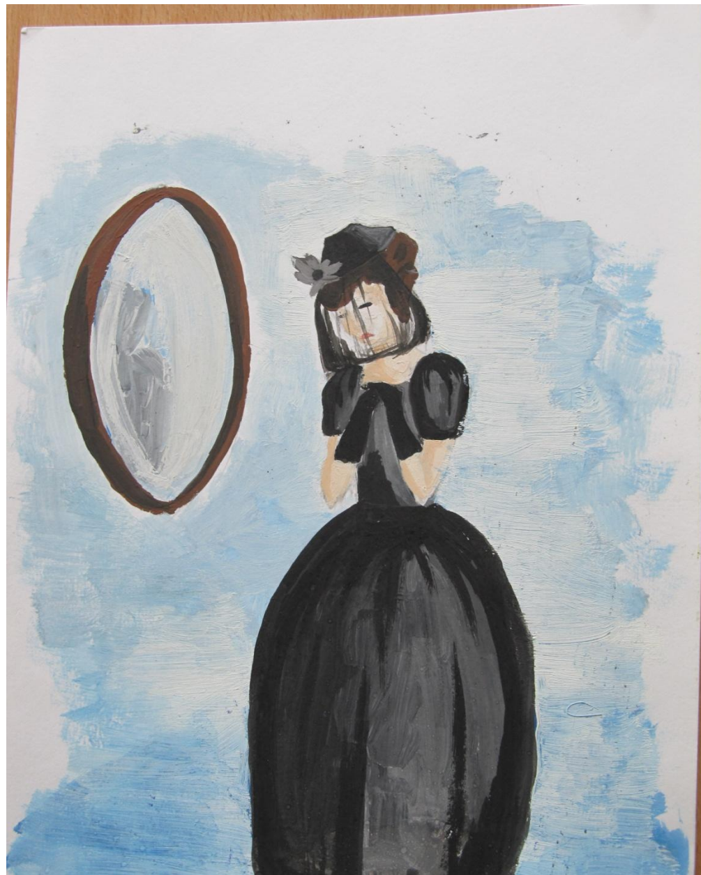
«Сжала руки под темной вуалью...» Автор: Астахова Елена