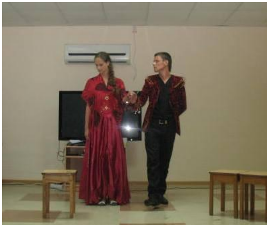
Спектакль «Повесть о Петре и Февронии Муромских»