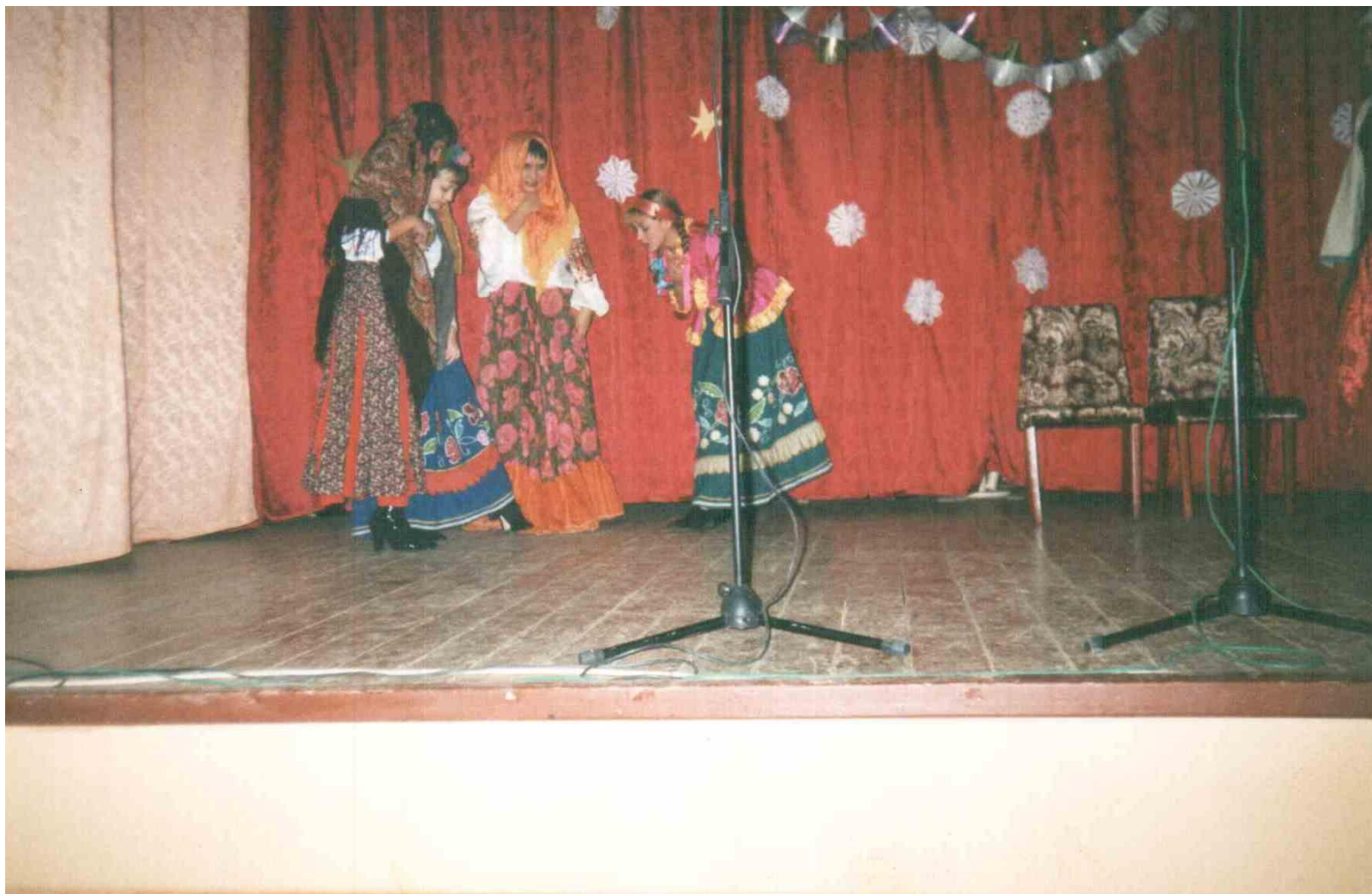
Школьный спектакль «Ночь перед Рождеством» «Одарка, у тебя новые черевички?»