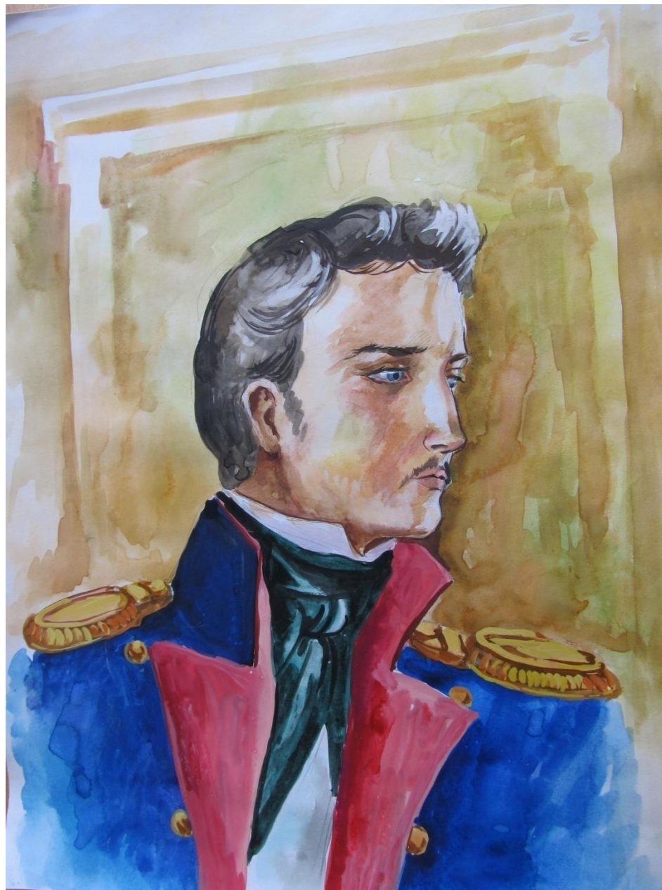
Портрет Печорина. Автор: Неткачева Вера