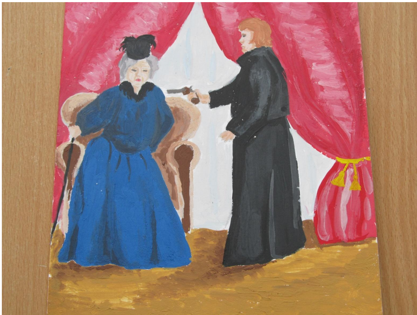
«Пиковая дама», автор: Астахова Елена