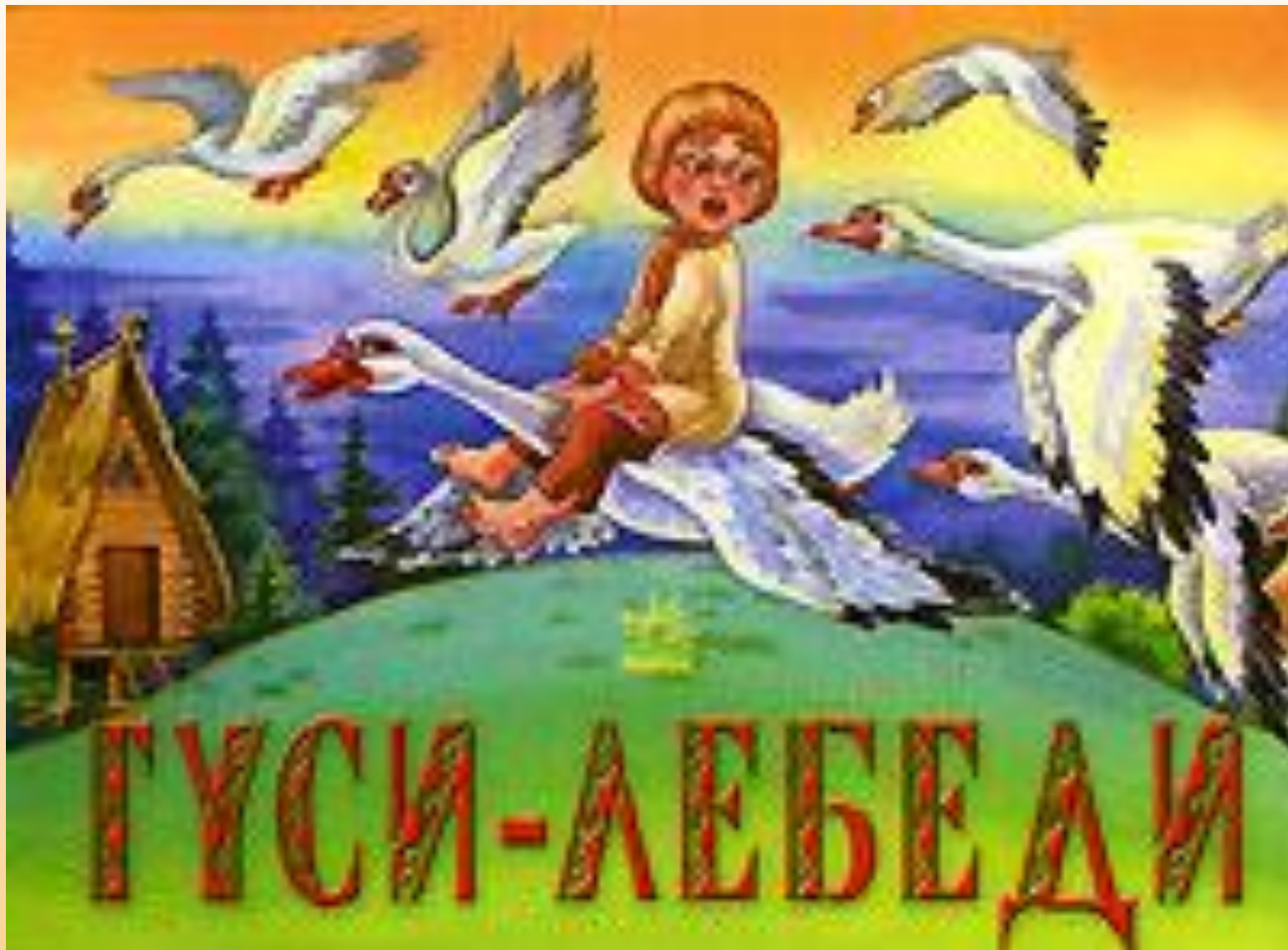
Русская народная сказка