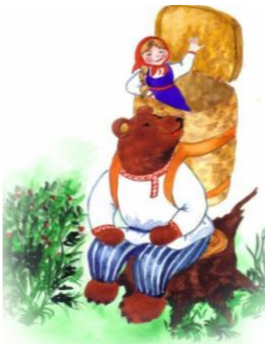
Машень ка и