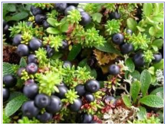
во р оника