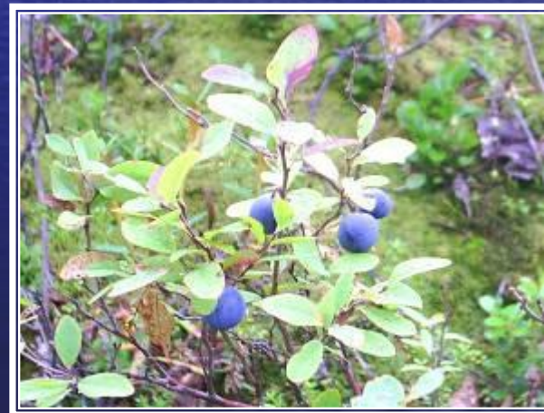
че р ника