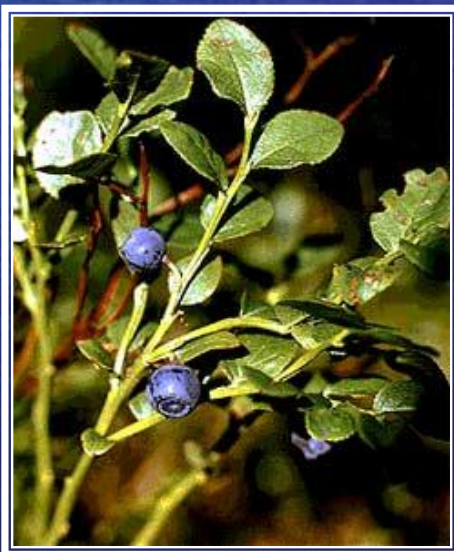
го л убика