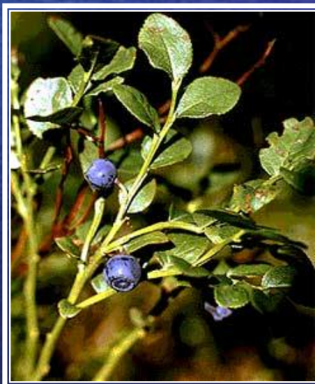
го л убика