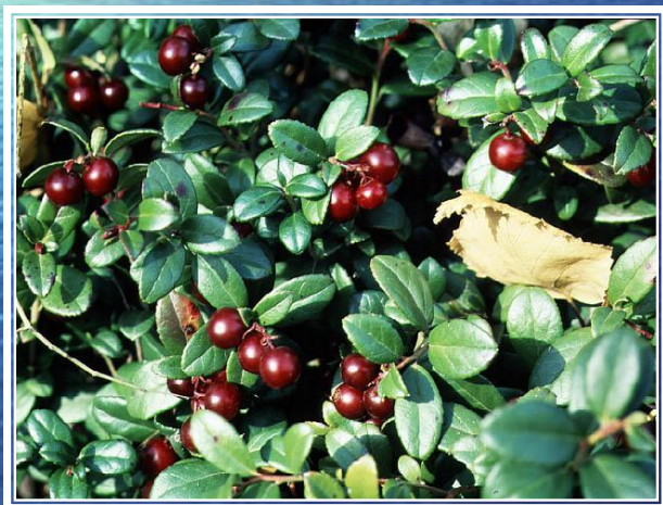
бру с ника