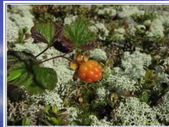
мо р озка