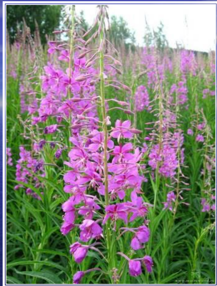
Иван – чай ( кипрей)