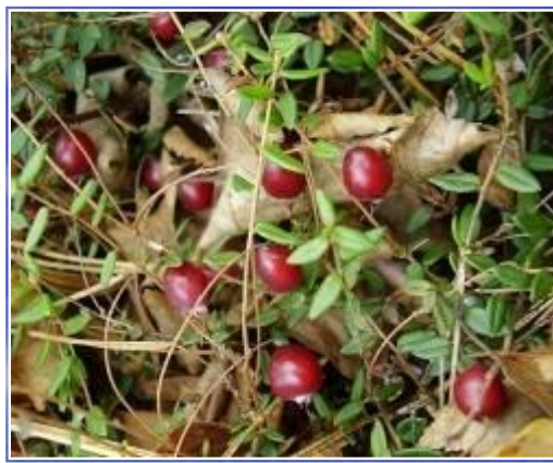
к л юква