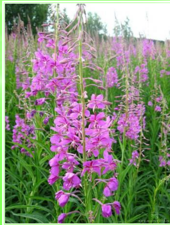
Иван – чай ( кипрей)