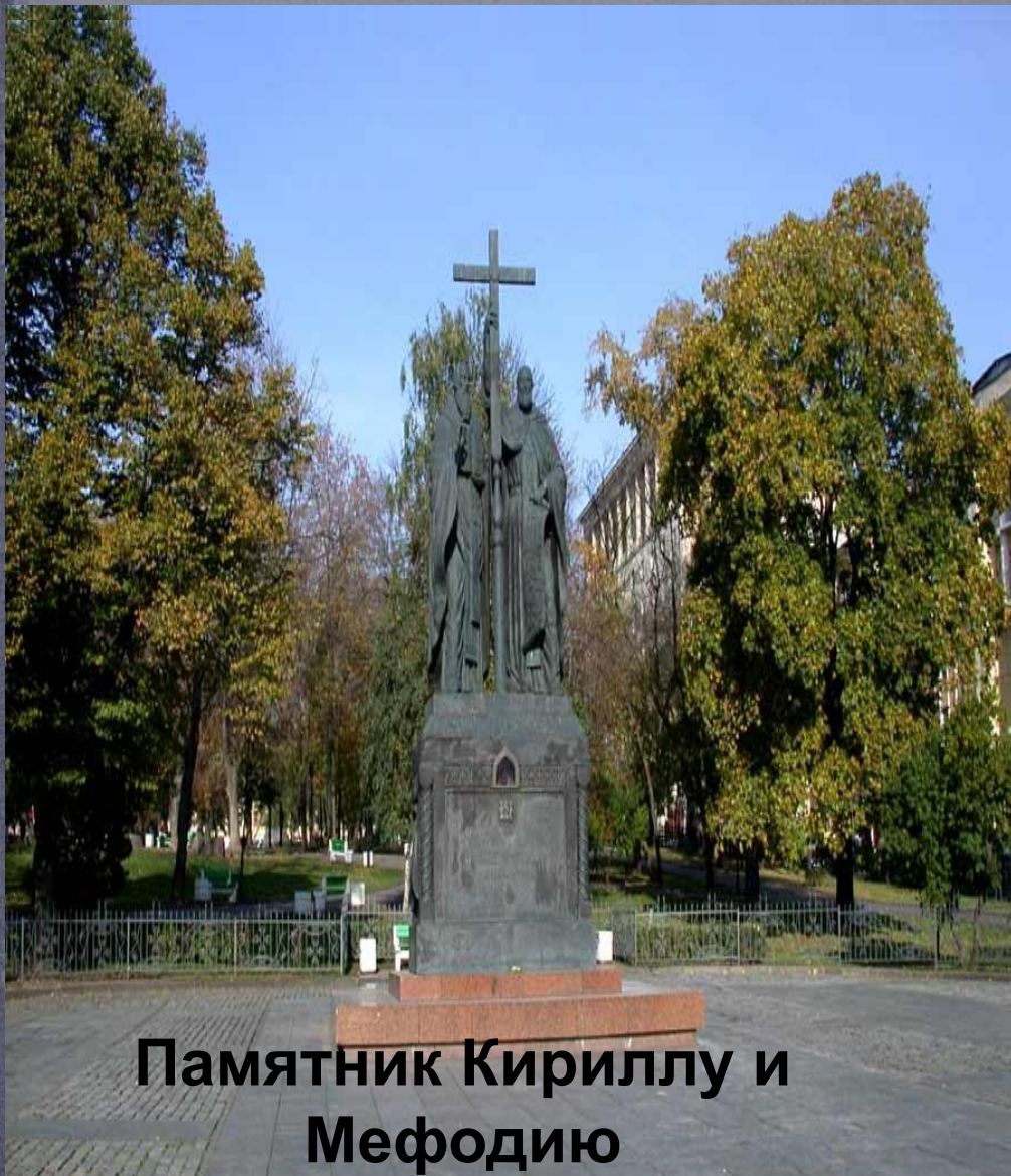
Памятник Кириллу и Мефодию