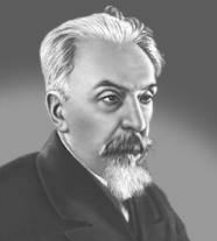
Лев Владимирович Щерба (1880-1944)

Слова категории состояния ученые характеризуют по-разному. Слова категории состояния выделил Л. В. Щерба в 1928 г., включив в эту особую, как он считал, часть речи слова, которые обозначают состояние человека и окружающей среды. К этой части речи он относил слова радостно, можно, нельзя, душно, нужно, темно.