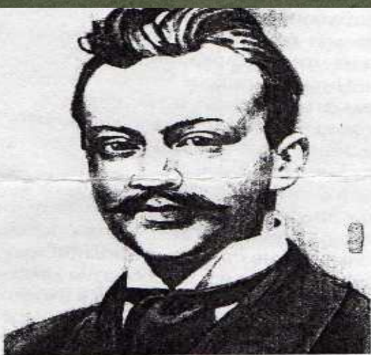
Дмитрий Николаевич Ушаков.

словарей . Даль В. И., Д.Н. Ушаков, С.И.Ожегов