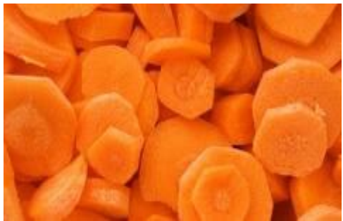
резаная ..... масло