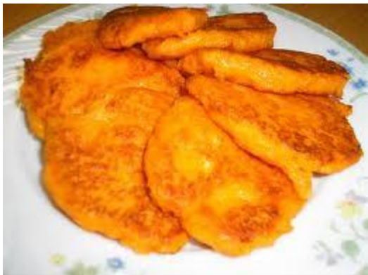
..... оладьи цвета