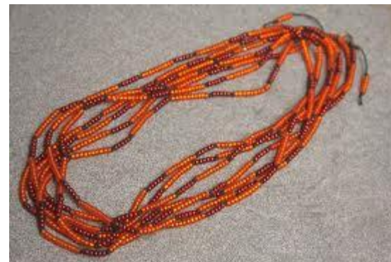
бусы морковного цвета