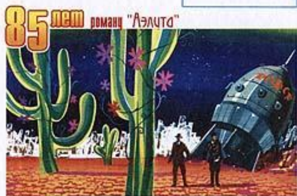
XXV Европейско-Азиатский конвент Фантастики АЭПИТА (Екатеринбург, 21-24 мая 2008)