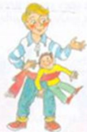
Заткнуть за пояс