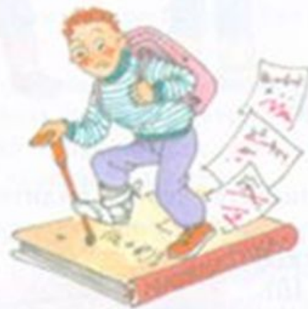
Хромает по математике