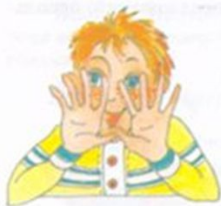
Смотреть сквозь пальцы