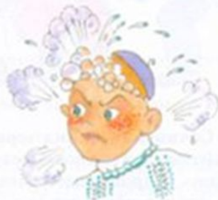
Кипит от негодования