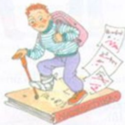
Хромает по математике