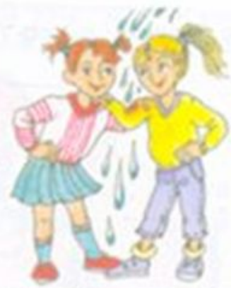
Водой не разольёшь