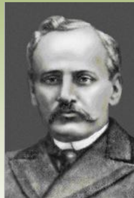
Шахматов Алексей Александрович (1864–1920)

Предложение – это единица речи, воспринимаемая говорящим и слушающим, как грамматическое целое, и служащая для словесного выражения единицы мышления.