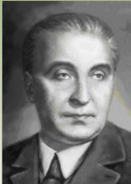
Виктор Владимирович Виноградов (1895–1969)

Предложение – это грамматически оформленная по законам данного языка целостная (т. е. неделимая далее на речевые единицы с теми же основными структурными признаками) единица речи, являющаяся главным средством формирования, выражения и сообщения мысли. В предложении выражается не только сообщение о действительности, но и отношение к ней говорящего.