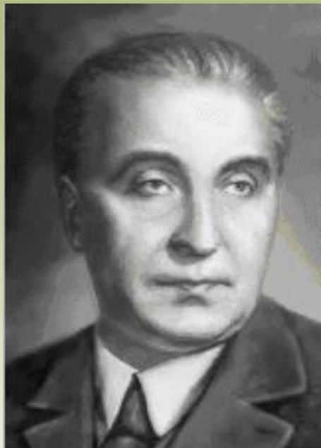
Виктор Владимирович Виноградов (1895–1969)

называется грамматическое единство, состоящее не менее чем из двух полнозначных слов, являющееся строительным материалом для предложения. Словосочетание, в отличие от предложения, ... не является цельной единицей языкового общения и сообщения.