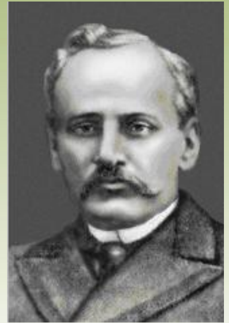
Шахматов Алексей Александрович (1864–1920)

Предложение – это единица речи, воспринимаемая говорящим и слушающим, как грамматическое целое, и служащая для словесного выражения единицы мышления.