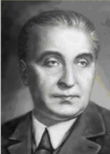
Виктор Владимирович Виноградов (1895–1969)

называется грамматическое единство, состоящее не менее чем из двух полнозначных слов, являющееся строительным материалом для предложения. Словосочетание, в отличие от предложения, ... не является цельной единицей языкового общения и сообщения.