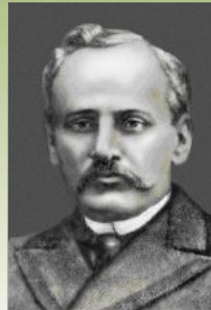
Шахматов Алексей Александрович (1864–1920)

Предложение – это единица речи, воспринимаемая говорящим и слушающим, как грамматическое целое, и служащая для словесного выражения единицы мышления.