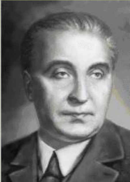
Виктор Владимирович Виноградов (1895–1969)

называется грамматическое единство, состоящее не менее чем из двух полнозначных слов, являющееся строительным материалом для предложения. Словосочетание, в отличие от предложения, ... не является цельной единицей языкового общения и сообщения.