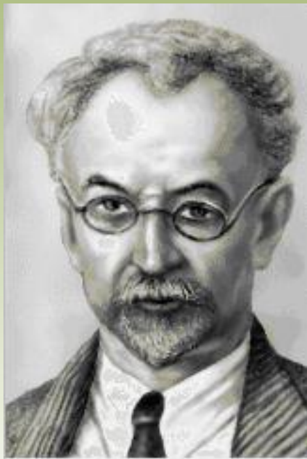
Алексей Матвеевич Пешковский (1878–1933)

Словосочетания, имеющие в своём составе сказуемое, или указывающие своим формальным составом на опущенное сказуемое, или, наконец, состоящие из одного сказуемого; все такие словосочетания мы будем называть предложениями.