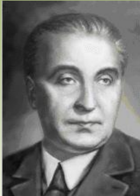
Виктор Владимирович Виноградов (1895–1969)

Предложение – это грамматически оформленная по законам данного языка целостная (т. е. неделимая далее на речевые единицы с теми же основными структурными признаками) единица речи, являющаяся главным средством формирования, выражения и сообщения мысли. В предложении выражается не только сообщение о действительности, но и отношение к ней говорящего.