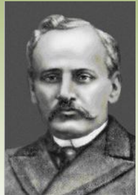
Шахматов Алексей Александрович (1864–1920)

Словосочетанием называется такое соединение слов, которое образует грамматическое единство, обнаруживаемое зависимостью одних этих слов от других.