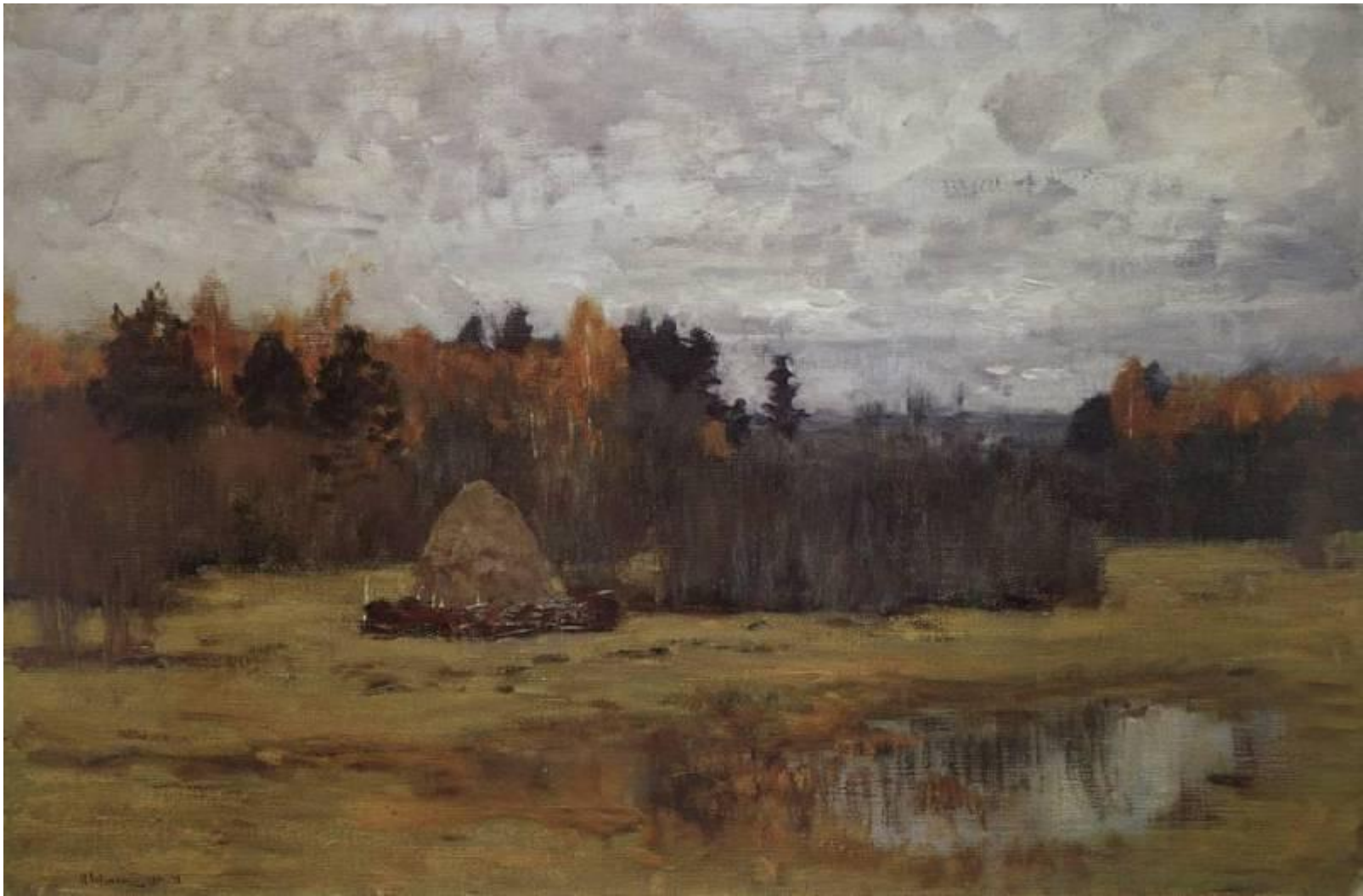
□ Поздняя осень. И.Левитан