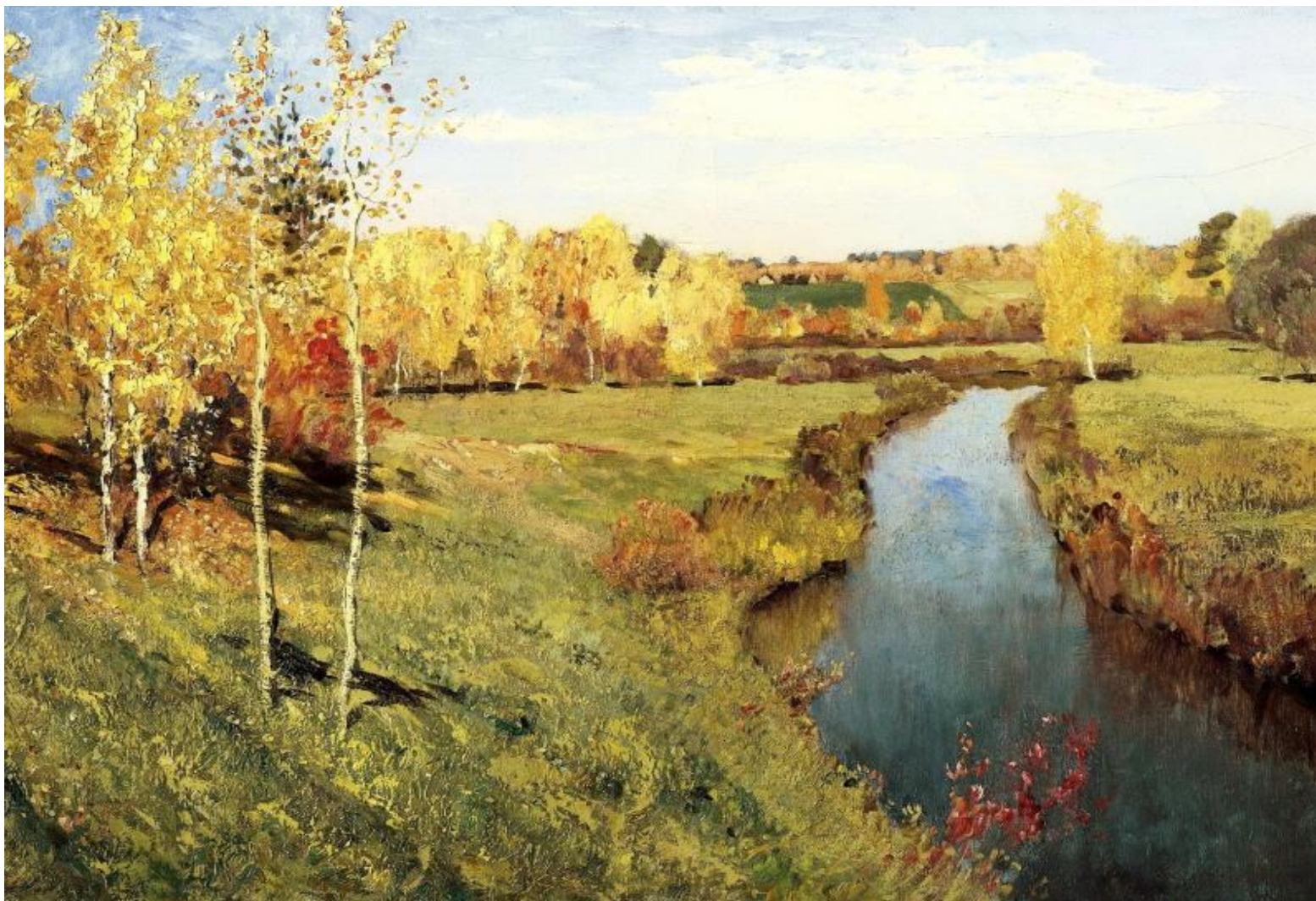
□ Золотая осень. И.Левитан