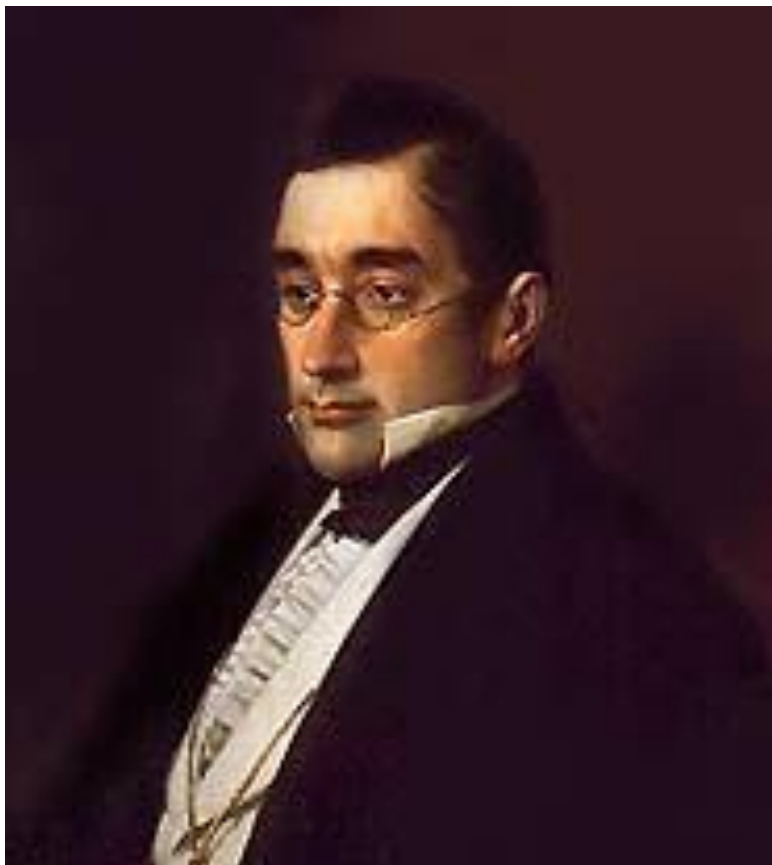
Александр Сергеевич Грибоедов