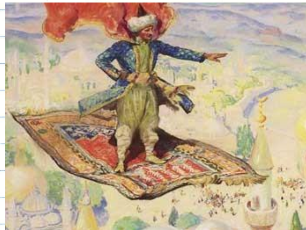
Ковер – самолет