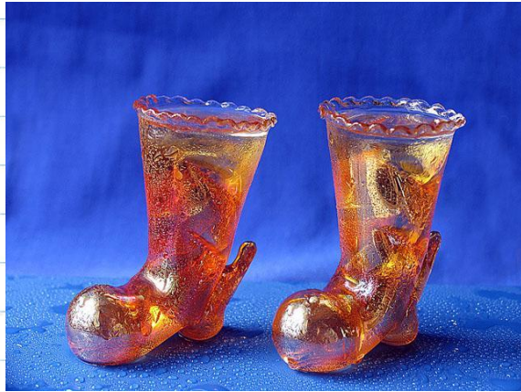
Сапоги – скороходы