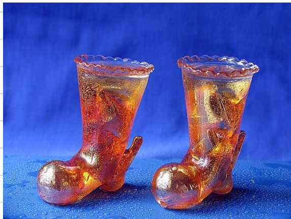
Сапоги – скороходы