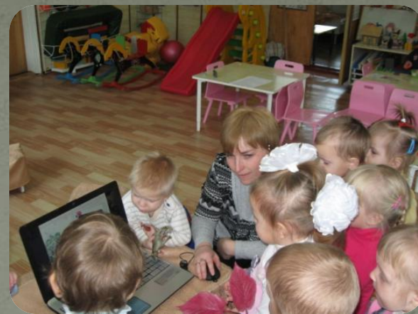
Осенний букет мы собрали для мамочки своей.