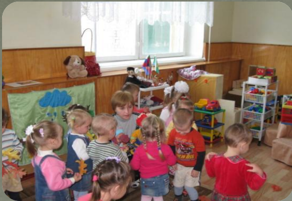
Знакомство куклой мамой и её дочкой .