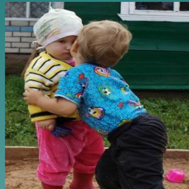
Два ребёнка Двое детей