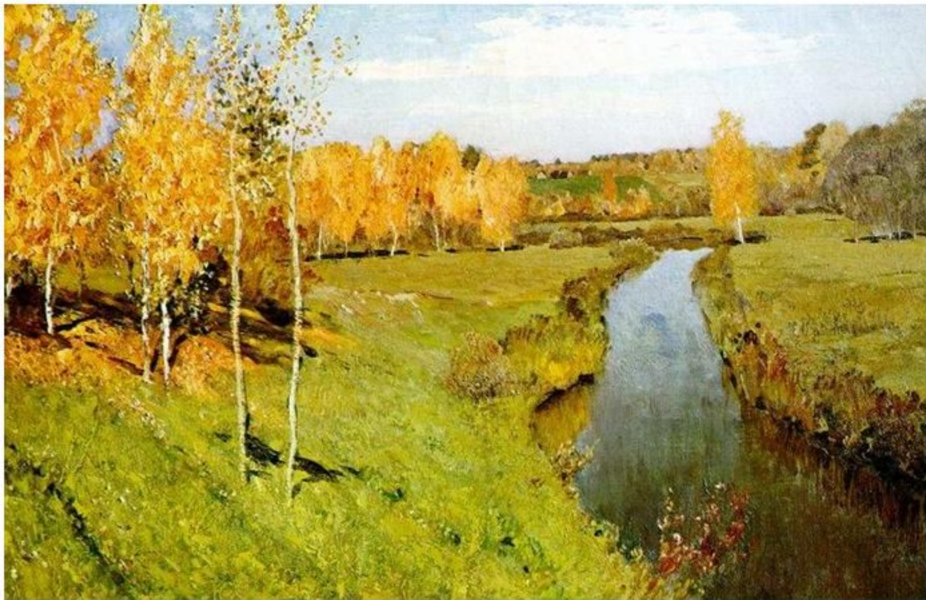
Золотая осень.Исаак Левитан