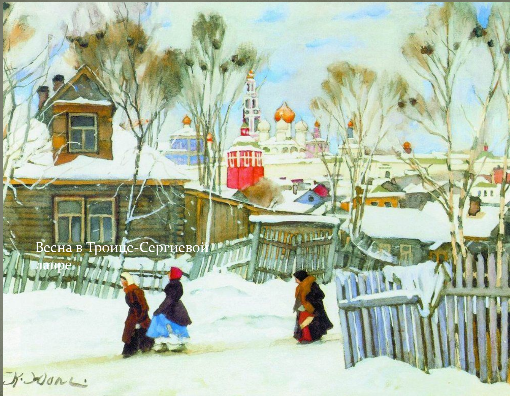
Весна в Троице-Сергиевой лавре