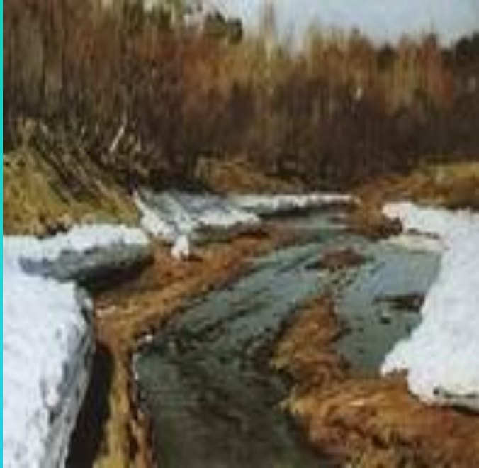
«Весна. Последний снег».

В весенних пейзажах солнце становится самым главным героем.