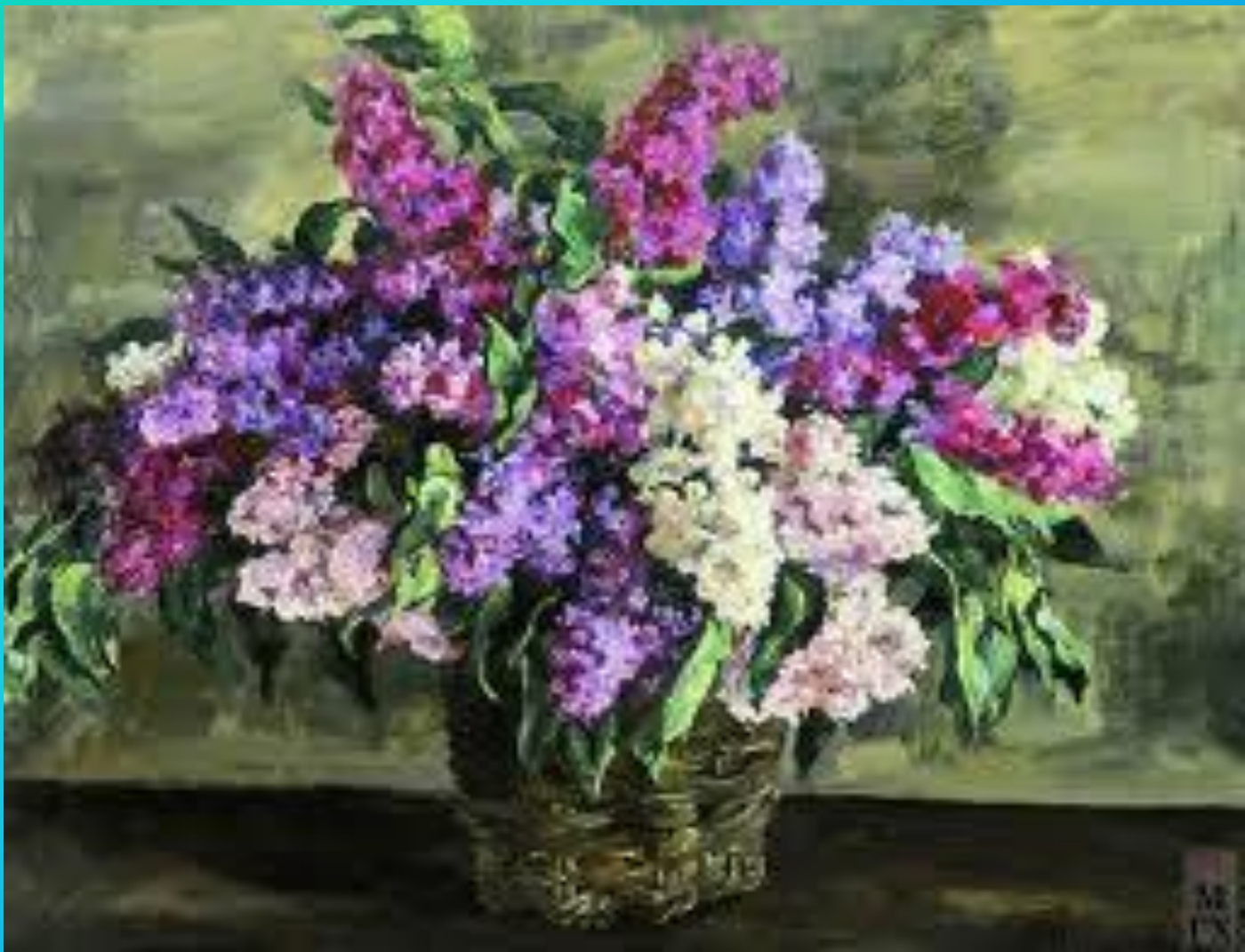
«Сирень в корзине»