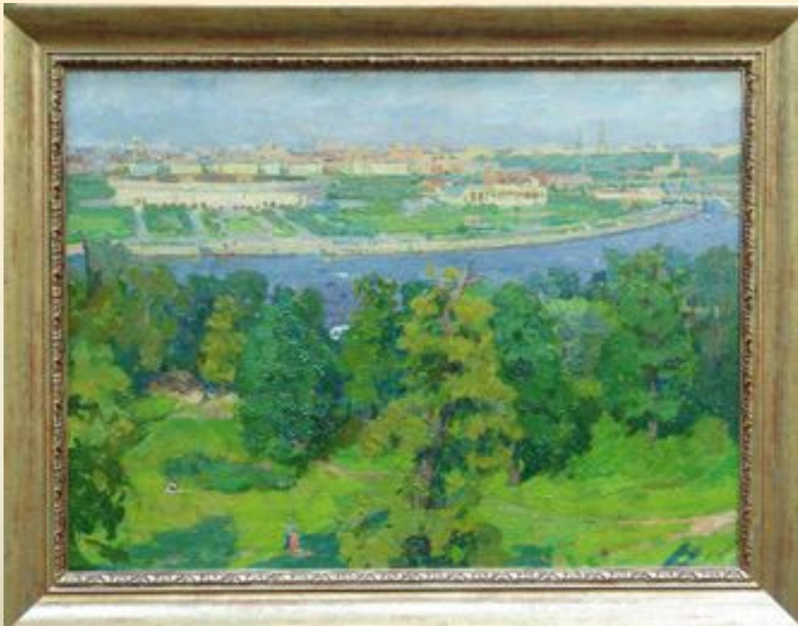
"Вид на Лужники с Воробьевых гор в Москве". 1967г