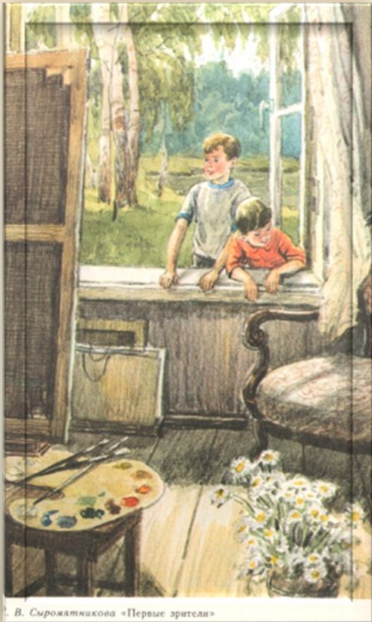
В. Сыромятникова «Первые зрители»