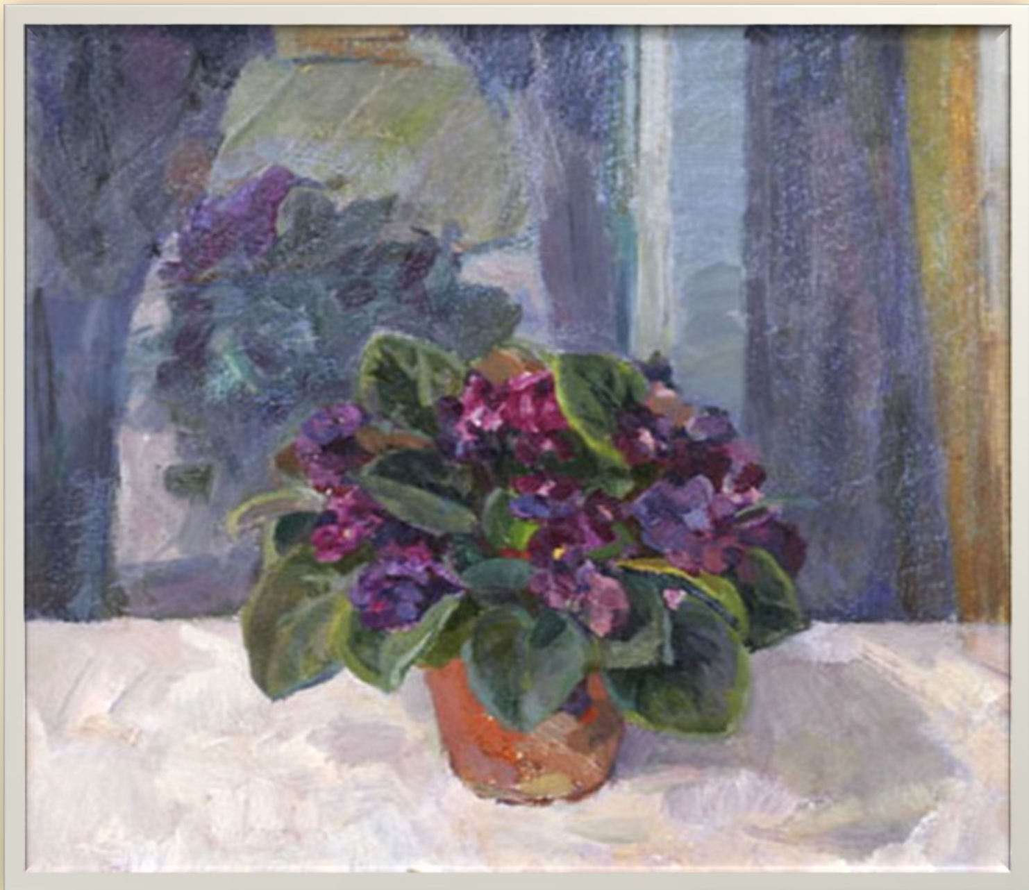
«Комнатный цветок» 1973 г.