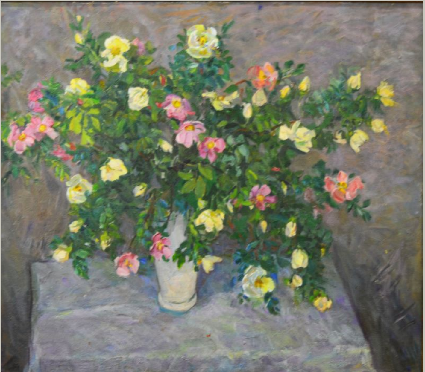
«Шиповник» Синцова И.В.