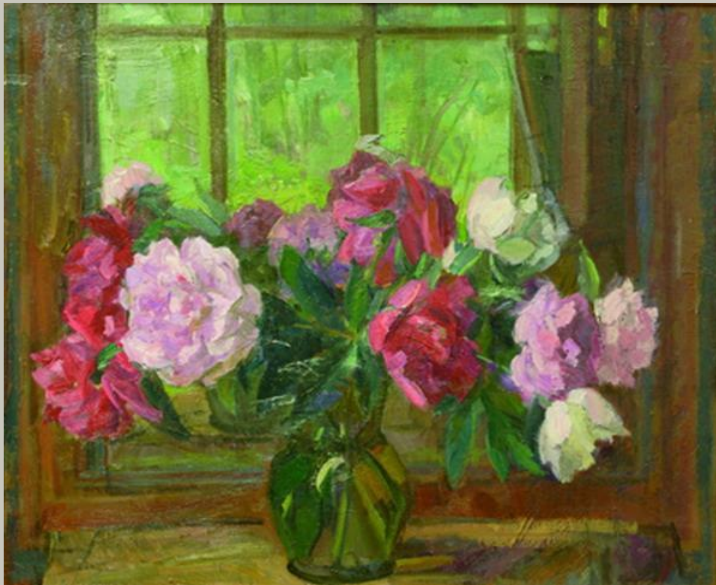
«Пионы» 1984 г. Спицына Т.В.