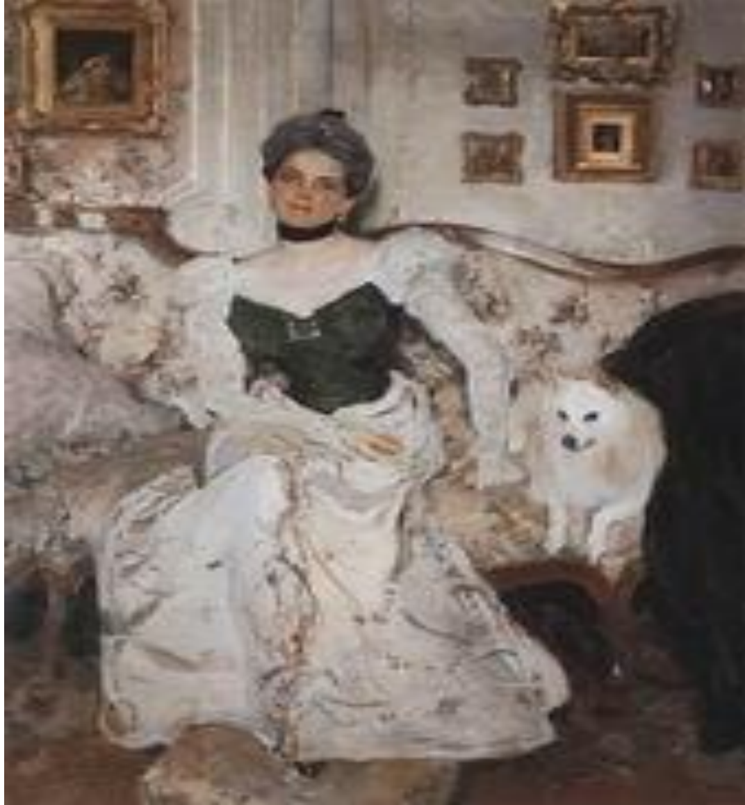
Портрет княгини З.Н.Юсуповой. 1902