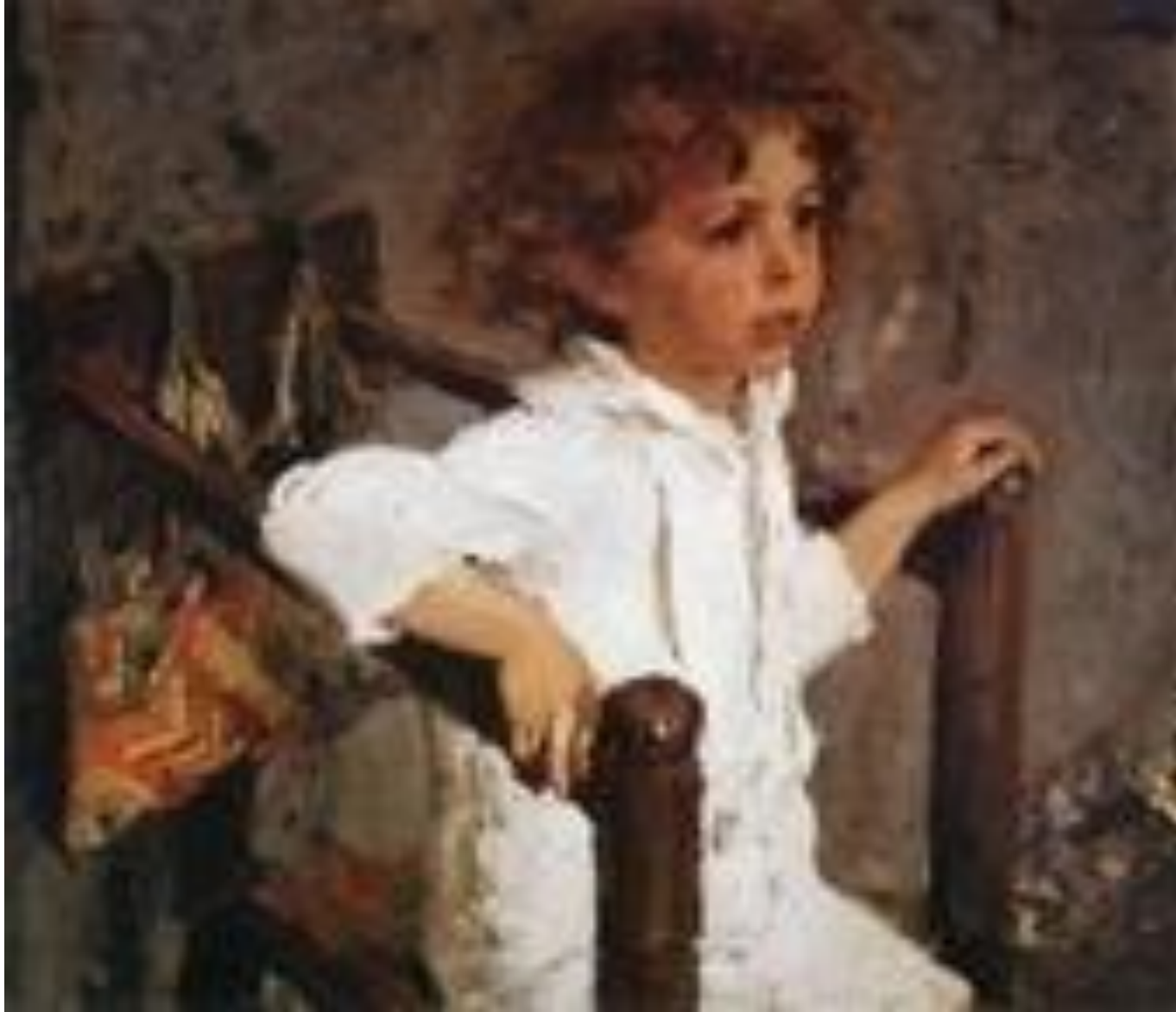
Мика Морозов. 1901