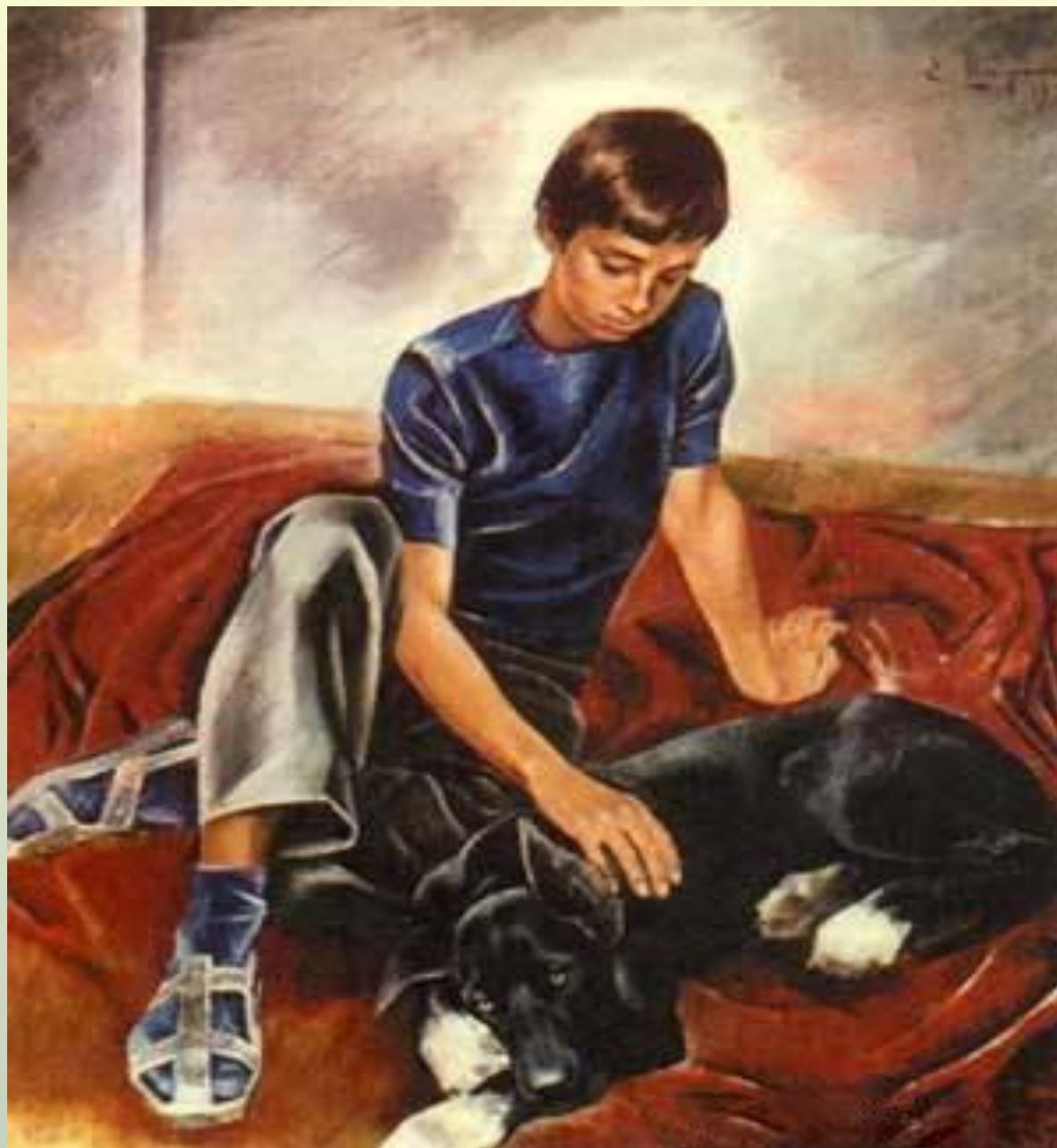
Е. Широков «Друзья»