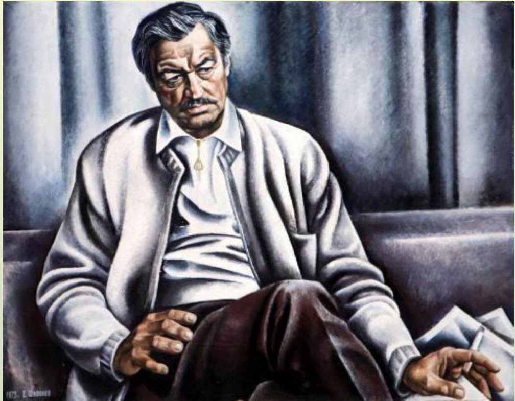
Портрет актера Е. Капеляна 1973 год