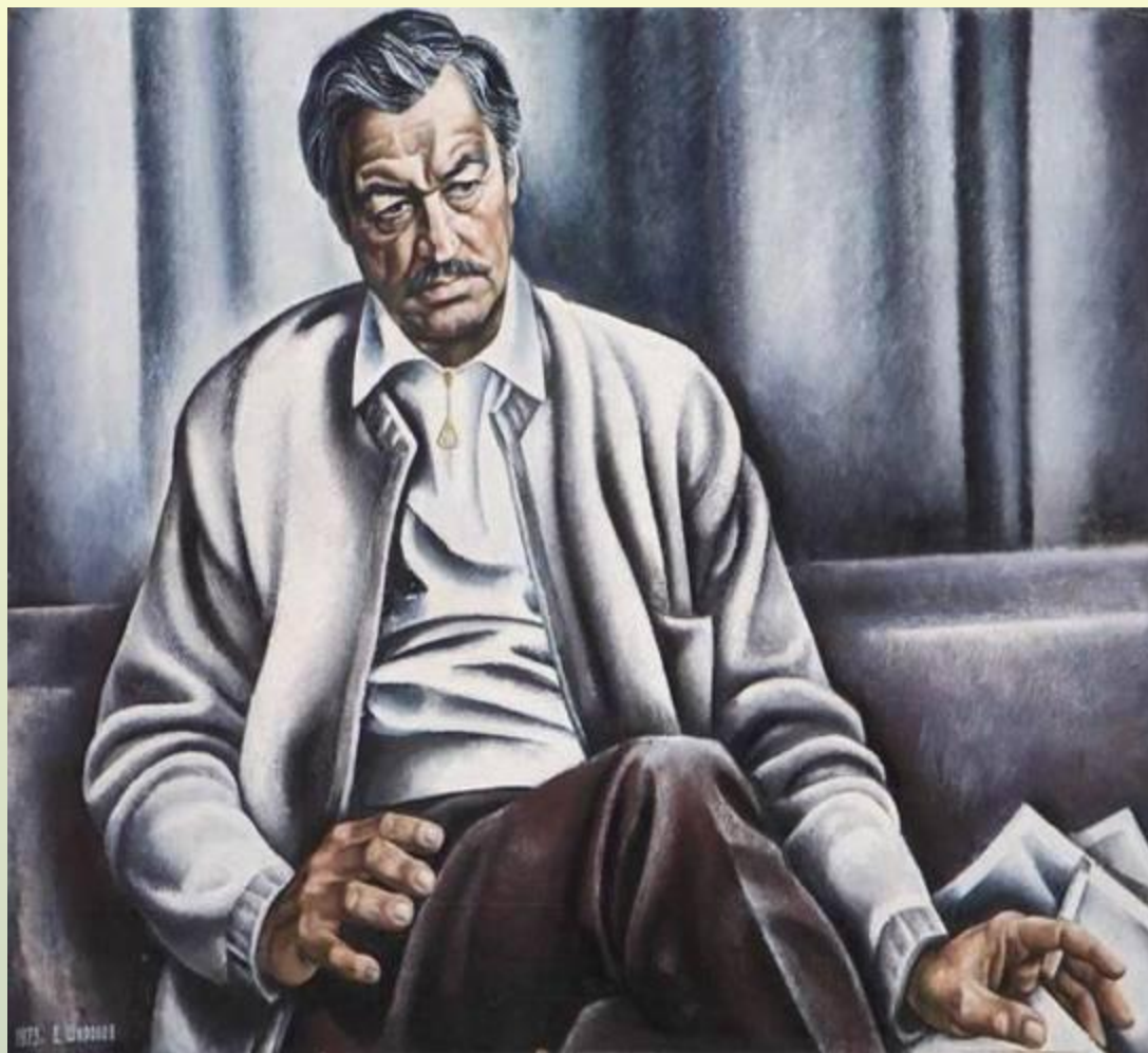
Портрет актера Е.Копеляна