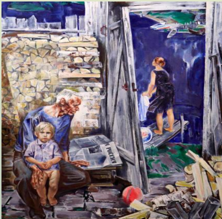
Посреди России 1983 год