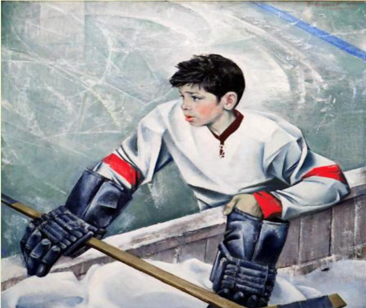
Юный хоккеист 1971 год