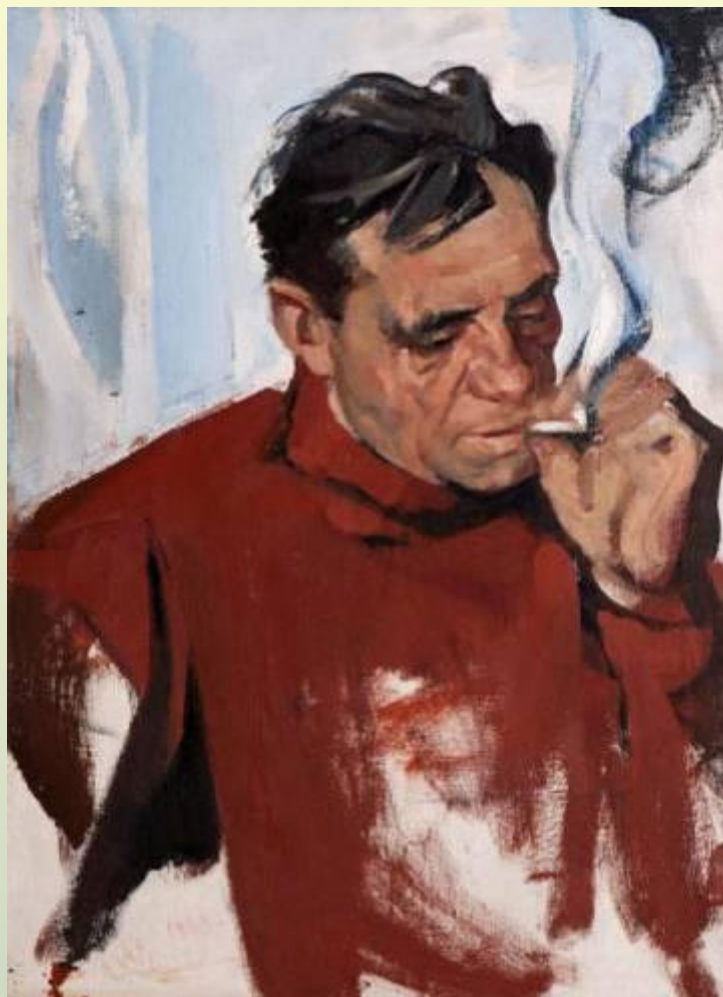
Портрет писателя В.Астафьева