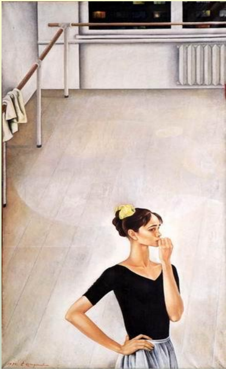
Портрет балерины Нади Павловой