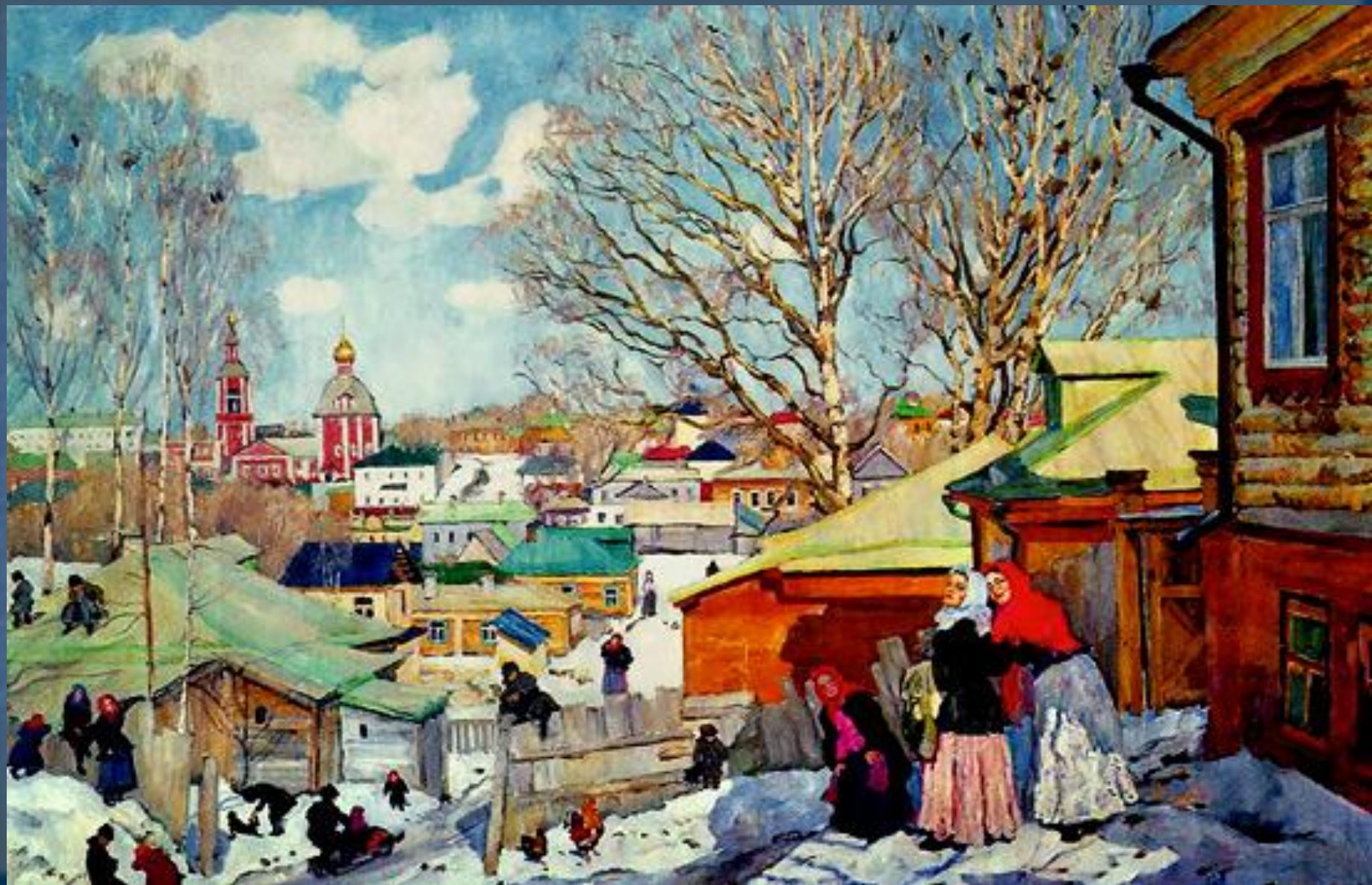
Картина К. Юона Весенний солнечный день. 1910 г.