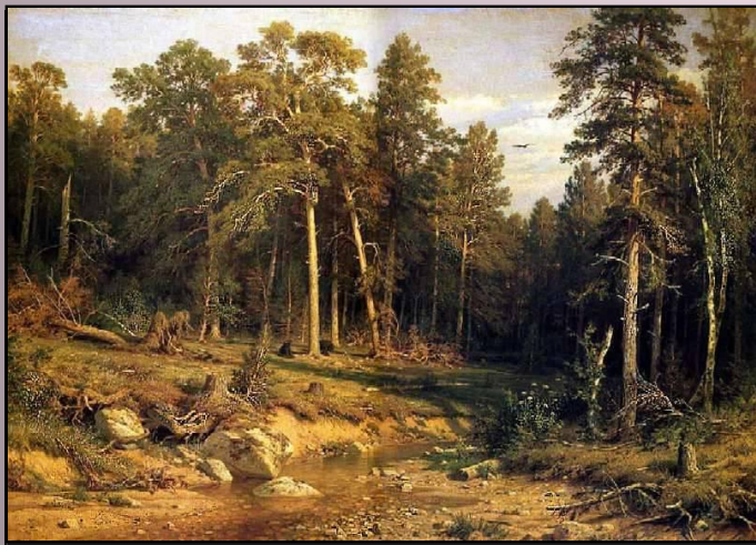
"Сосновый бор. Мачтовый лес в Вятской губернии", 1872 г.

Иван Иванович вступает в Артель художников, возглавляемую И. Н. Крамским, чьи идеи брать сюжеты из народной жизни и продвигать искусство в провинцию были ему близки.