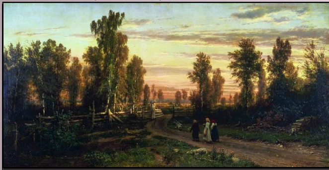
«Вечер», 1871 г.