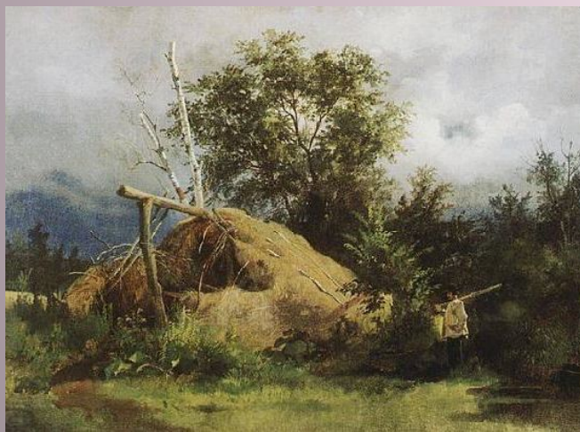
Шалаш, 1861 г.