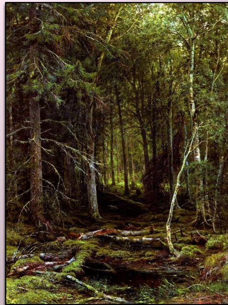
"Лесная глушь», 1873 г.

В 1873г присуждается звание профессора за картину "Лесная глушь".