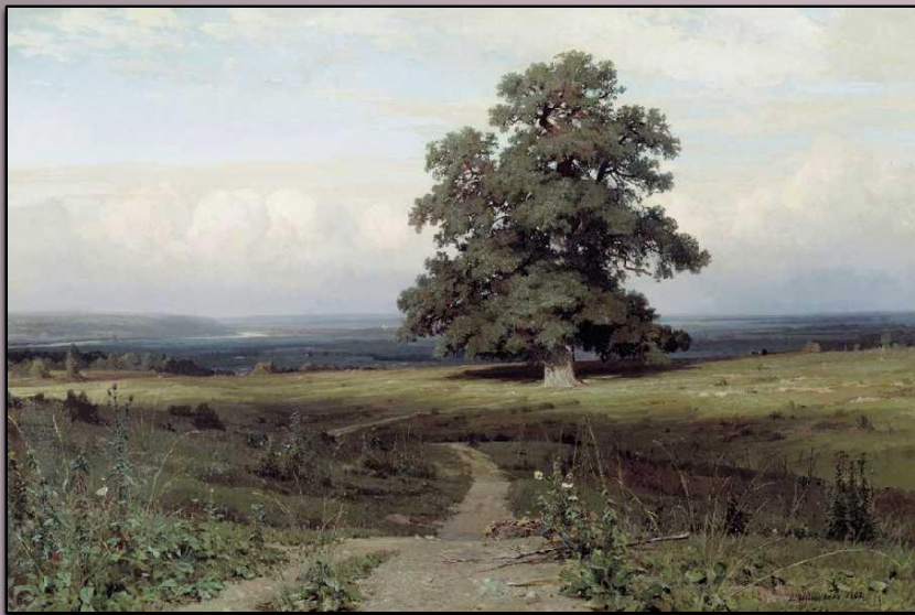
«Среди долины ровныя» ,1883 г.

Успех полотна «Среди долины ровныя» превзошел все ожидания. Привыкшие считать Шишкина «царем леса», «дедушкой лесов», «пейзажистом-лесовиком», зрители увидели перед собой обширную равнину, почувствовали настроение, созвучное тому, которое вызывала песня А. Ф. Мерзлякова, долгое время считавшаяся народной.