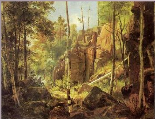
Вид на острове Валаам (местность Кукко), 1859-1860 гг.