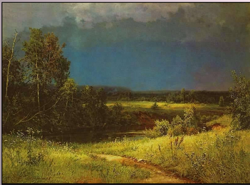
«Перед грозой», 1884 г.

Успех полотна «Среди долины ровныя» превзошел все ожидания. Привыкшие считать Шишкина «царем леса», «дедушкой лесов», «пейзажистом-лесовиком», зрители увидели перед собой обширную равнину, почувствовали настроение, созвучное тому, которое вызывала песня А. Ф. Мерзлякова, долгое время считавшаяся народной.