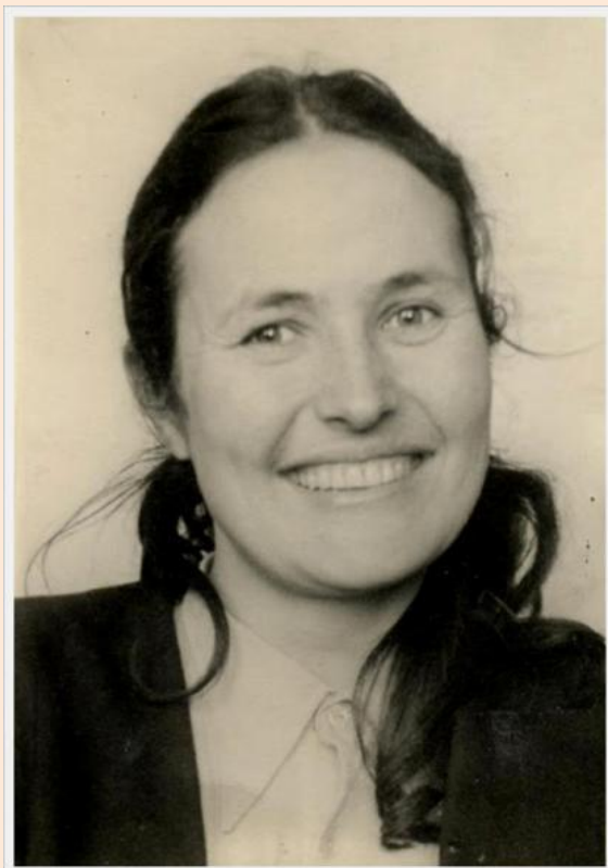
Фотография Яблонской Т.Н.

Татьяна Ниловна Яблонская (1917—2005) российский живописец, народный художник СССР (1982), действительный член Российской АХ (1992; действительный член АХ СССР с 1975). Государственные премии СССР (1950, 1951, 1979).