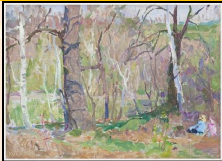
«Весна в парке» 1959