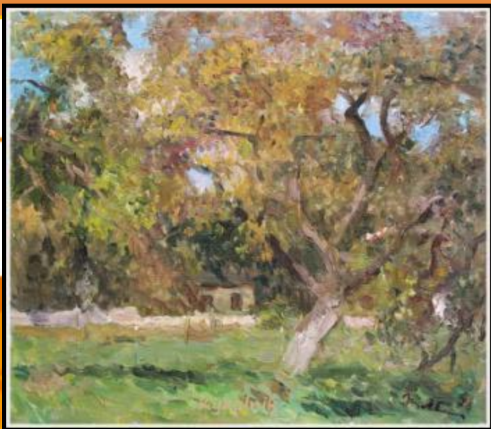
«Летний день» 1978