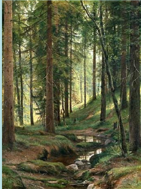
И. Шишкин. Ручей в лесу.