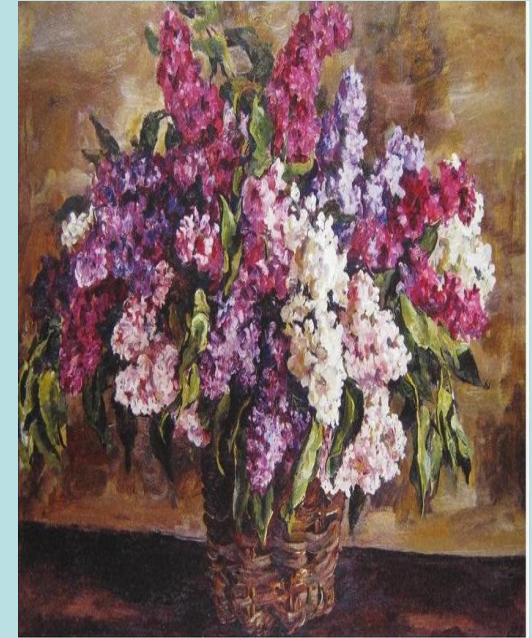
Сирень. П.П. Кончаловский

Вы видите произведения живописи. Каковы их жанры?