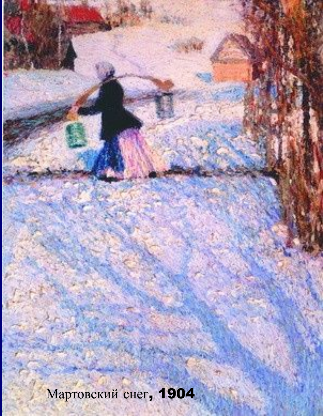
Мартовский снег, 1904