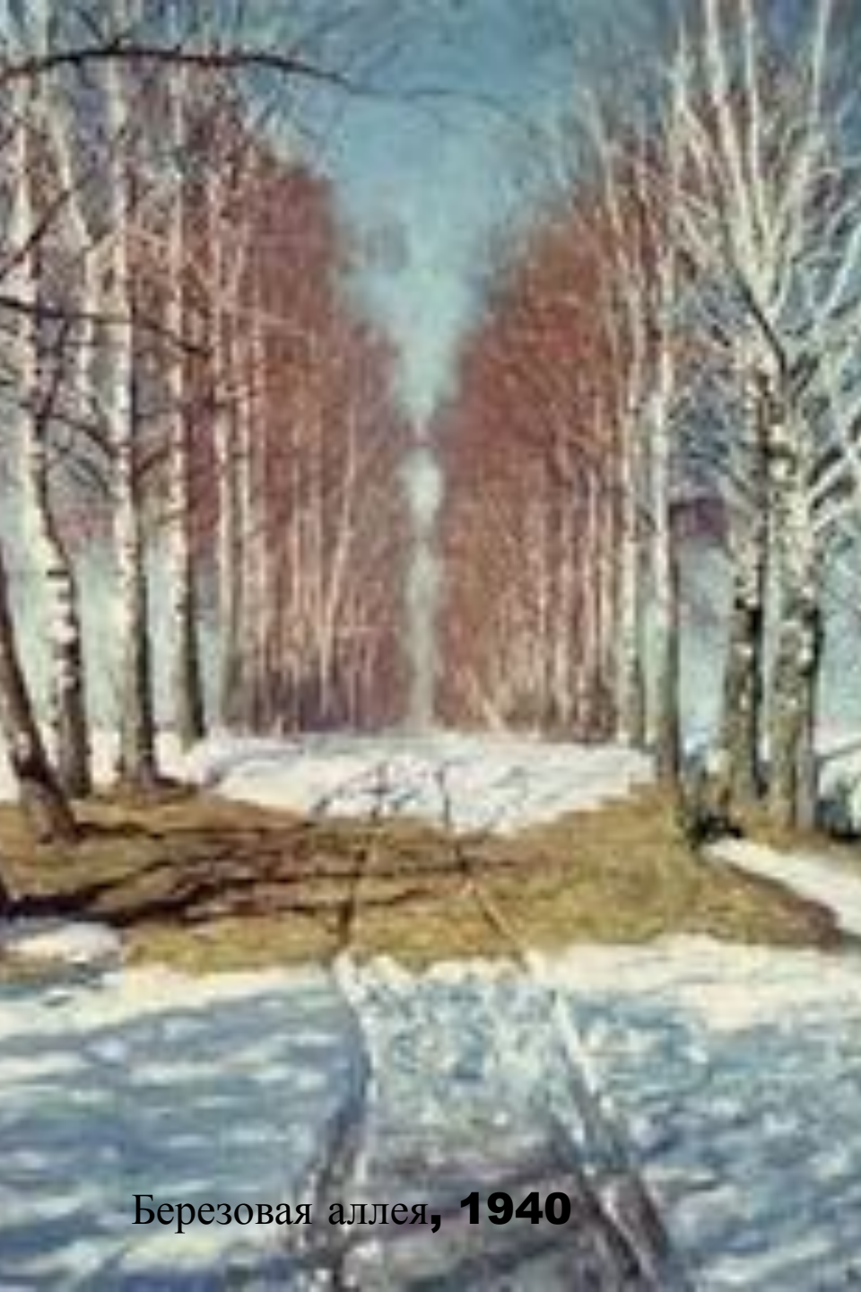
Березовая аллея, 1940