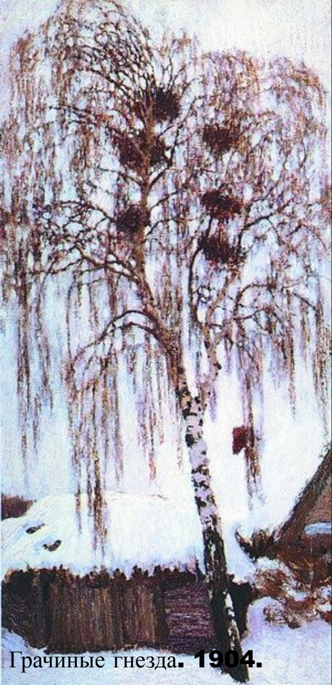
Грачиные гнезда. 1904.