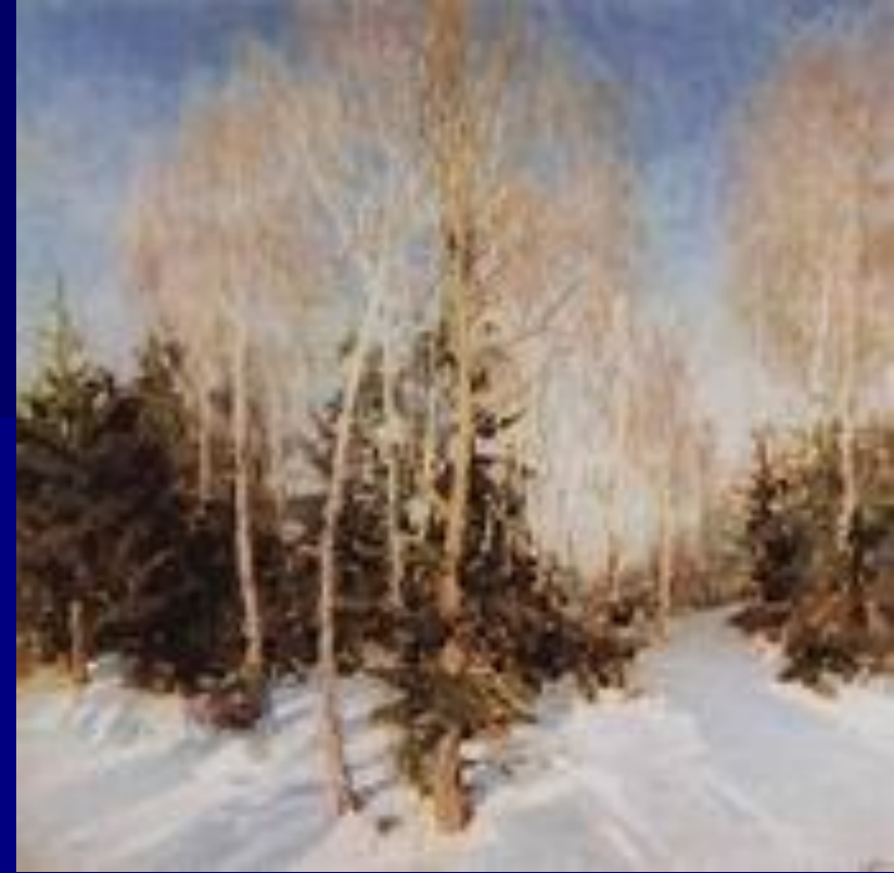
Зимний пейзаж, 1954

Пейзаж... Природа... Порой мы даже не замечаем той красоты, среди которой живем. Искусство пейзажа напоминает нам об этом. Каждый настоящий художник-пейзажист, внося в картину свое отношение к природе, как бы приглашает нас пристальнее взглянуть в нее и насладиться ею. А может, и пообщаться с ней. Не надо думать, что природа — это нечто неподвижное и молчаливое. Ведь не случайно поэт Федор Тютчев писал: