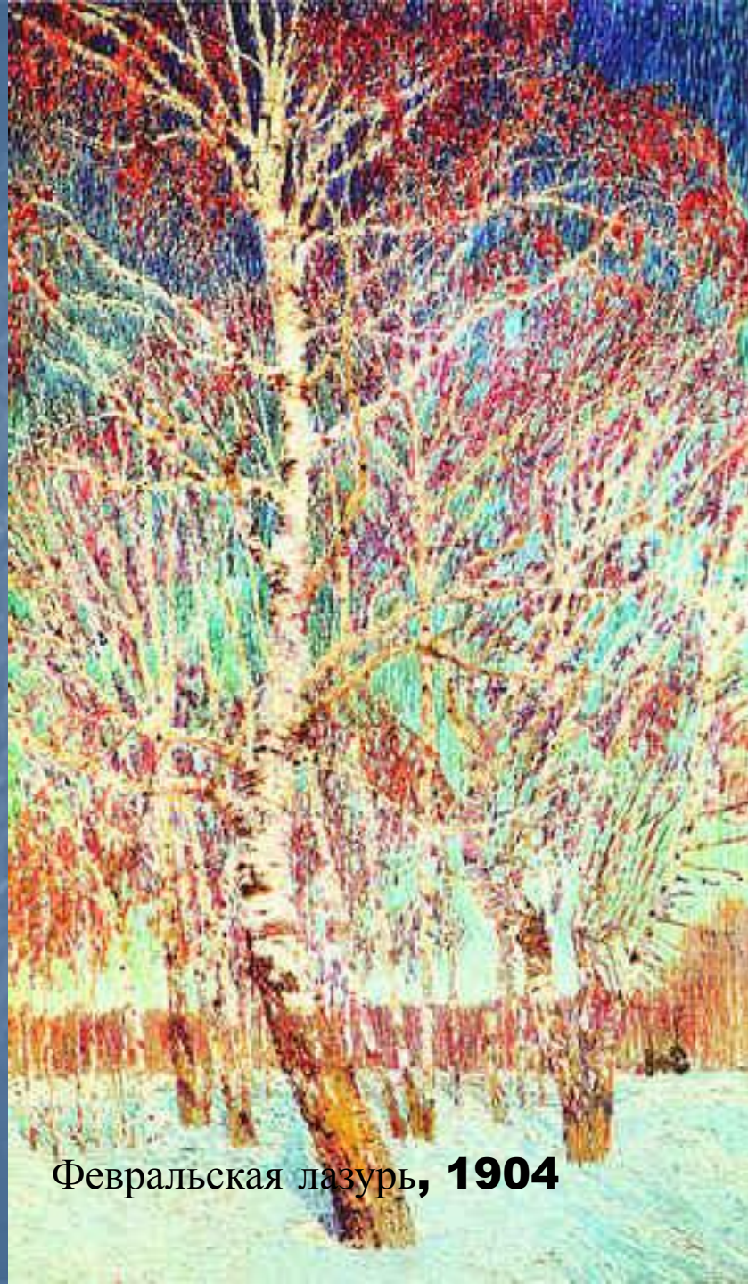
Февральская лазурь, 1904