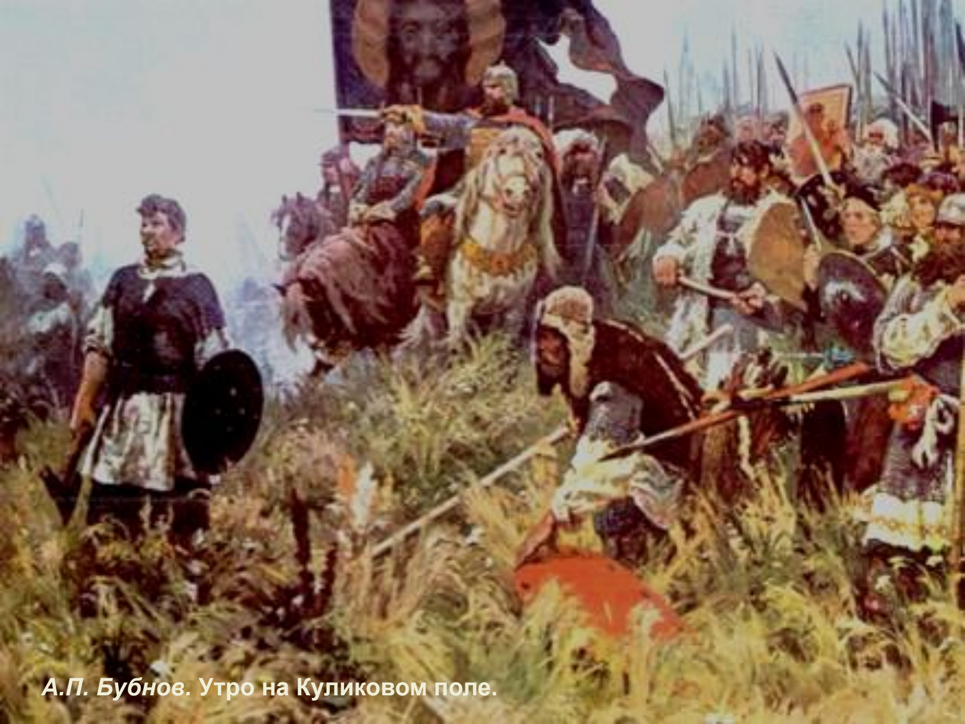
А.П. Бубнов. Утро на Куликовом поле.