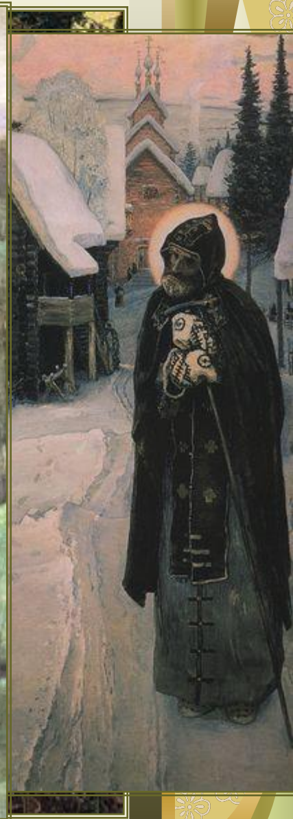
Н.В. Нестеров. Иудейский Сергий (Бадар) в пустыне.