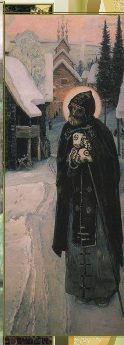
Н.В. Нестеров. Иудейский Сергий (Бадар) в пустыне.