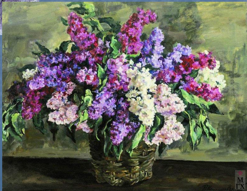
Сирень в корзине ("Героическая"). 1933. Х.М. 79x104. ГТГ, Москва.