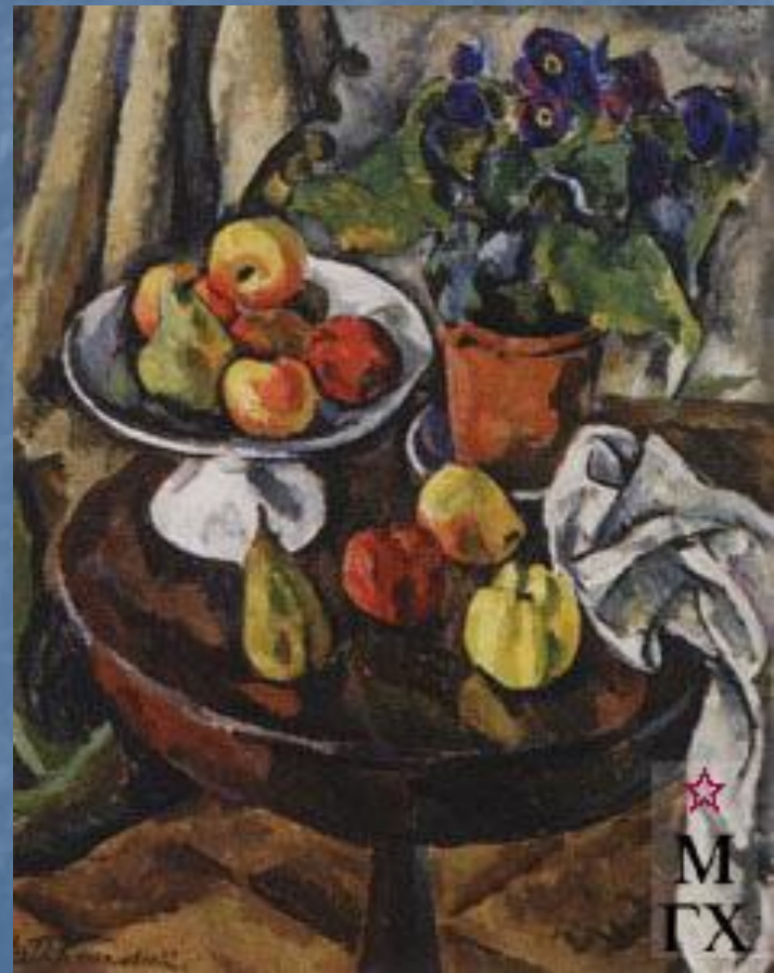
Натюрморт. Фрукты. 1911. Х.М. 73x58 см. Астраханская обл. картинная гал. им. Б.М. Кустодиева, Астрахань