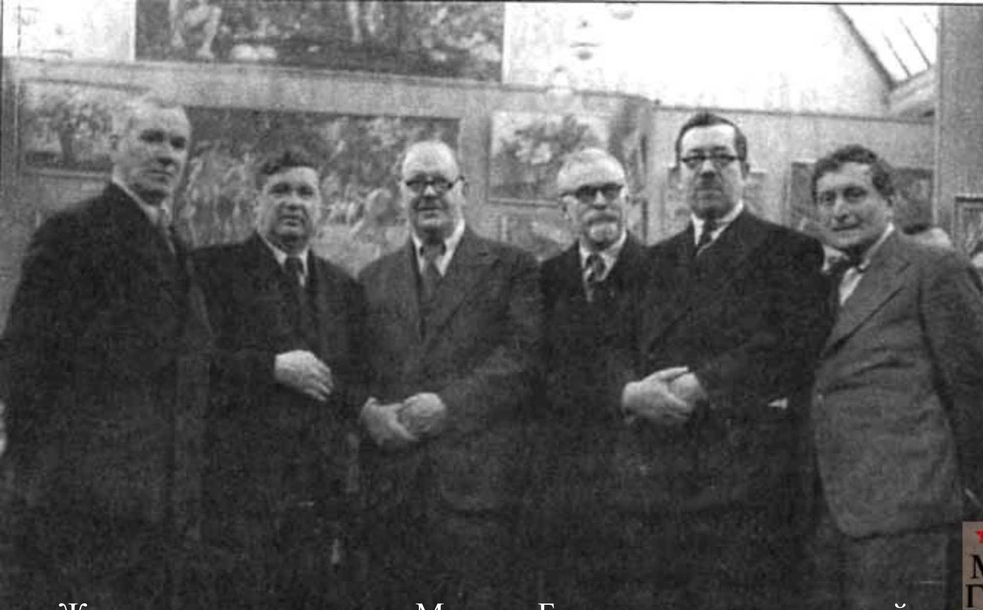
Жил преимущественно в Москве. Был одним из основателей общества "Бубновый валет" (1910).