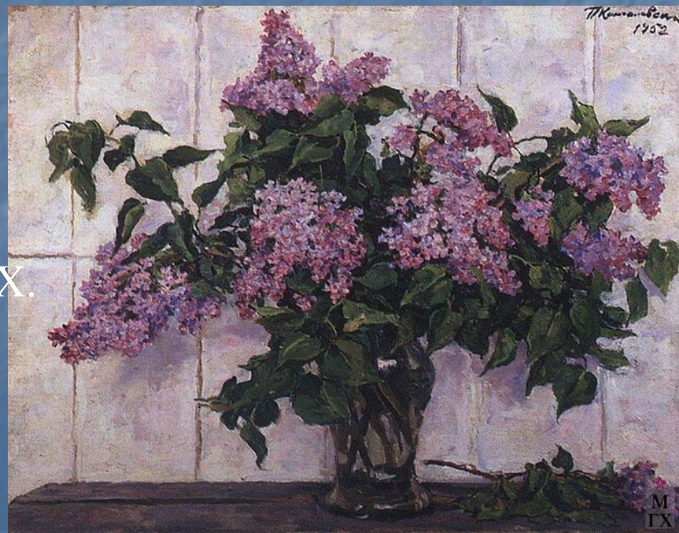
Сирень в стеклянной банке. 1952. Х. М. 74x92. Музей изобразительных искусств Республики Карелия, Петрозаводск.