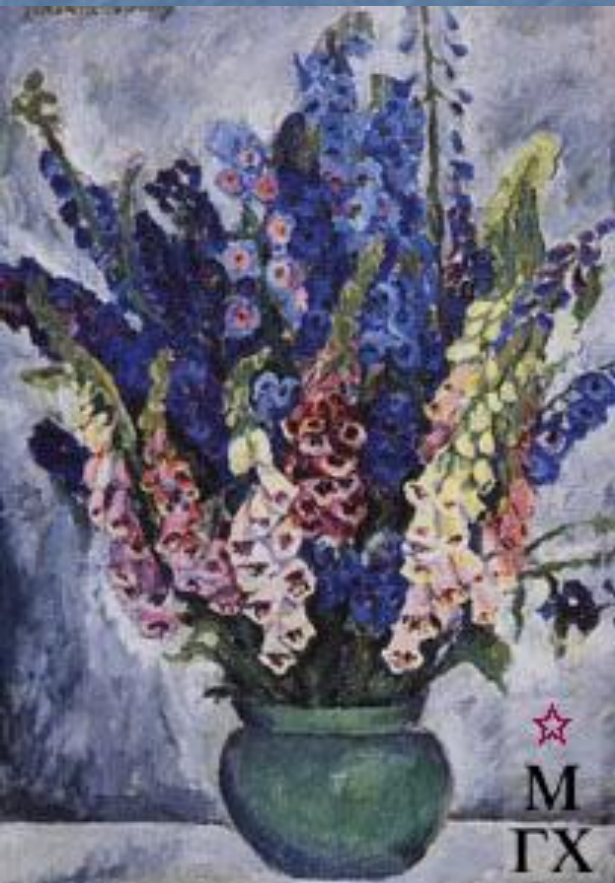
Цветы. Дигиталис. 1910. Х.М. 64x42 см. Нац.галерея Армении, Ереван

Натюрморт - картина с изображением крупным планом предметов: цветов, плодов, битой дичи, рыбы, утвари.