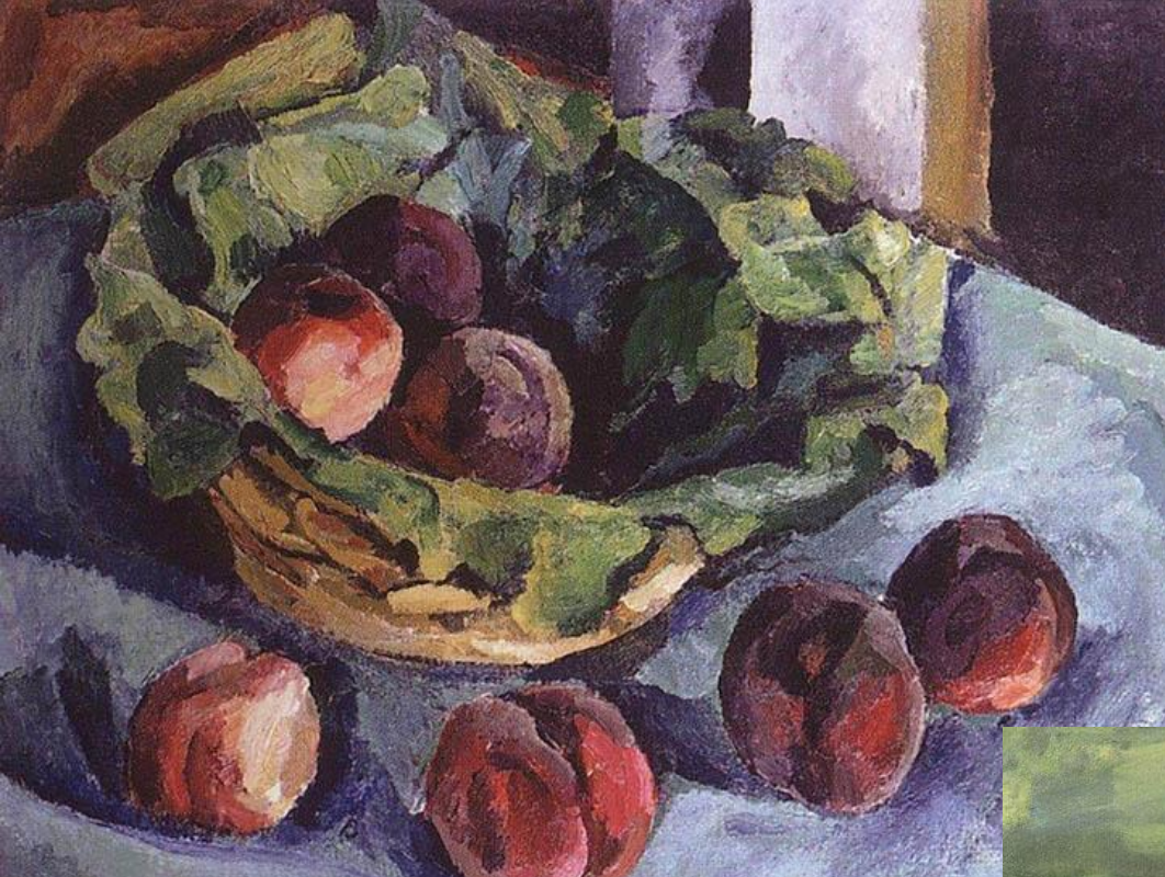
Персики. 1919. Х.М. 63,5x79,5. Кировский обл. худ. музей им. В. М. и А. М. Васнецовых, Киров.