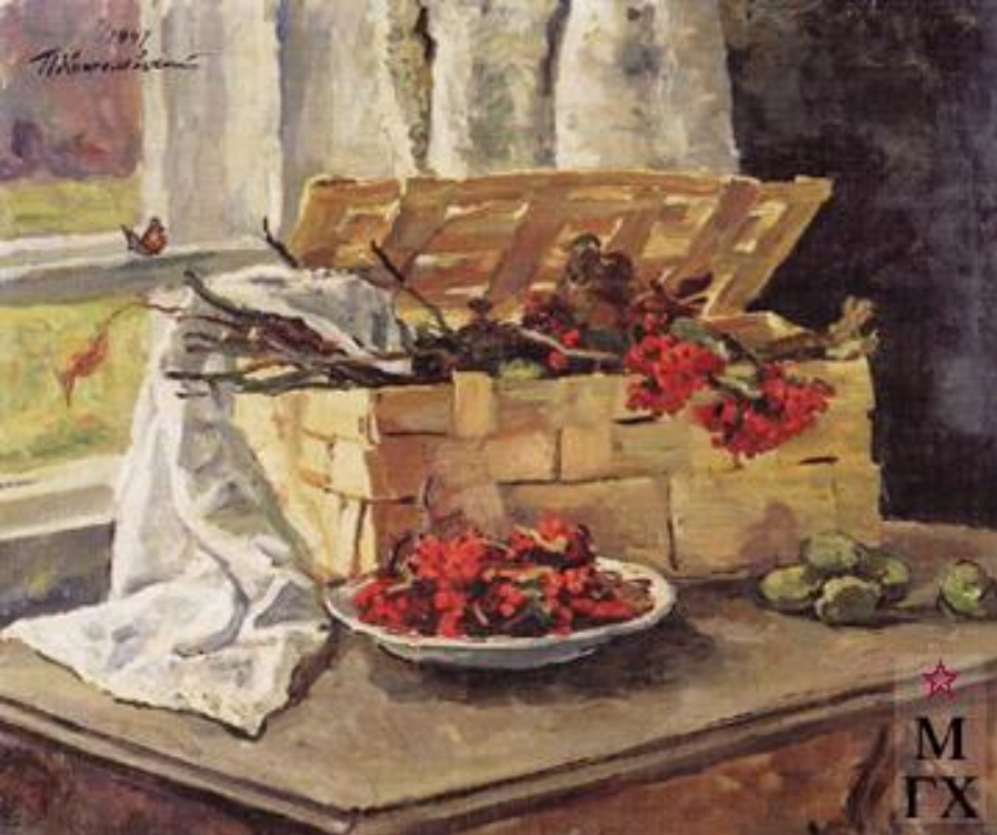
Корзина с рябиной. 1947. Х.М. 79x95,5. Нац. галерея Армении, Ереван.