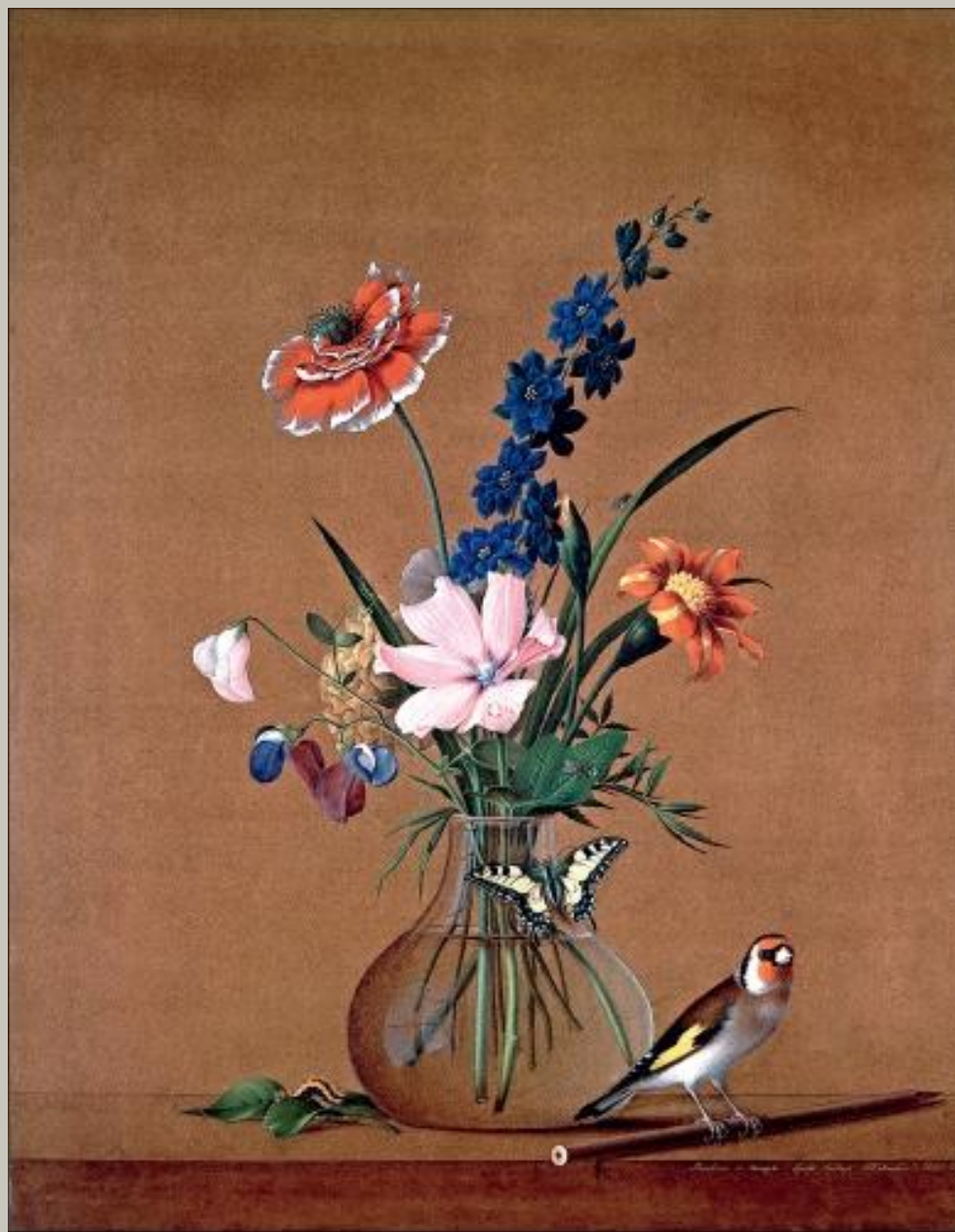
«Букет цветов, бабочка и птичка»