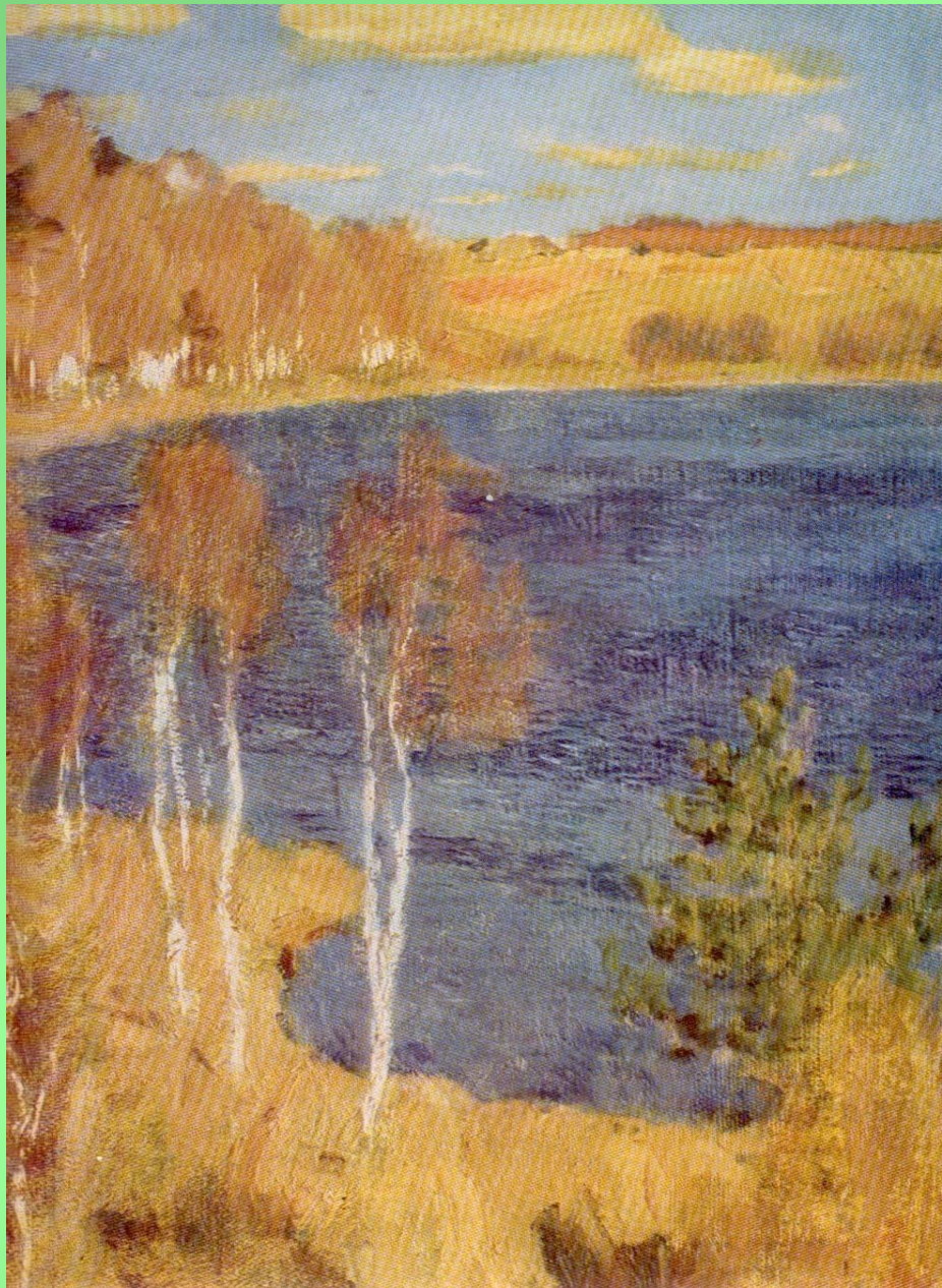
И. Левитан, 1860—1900. ВЕСНА, 1898.