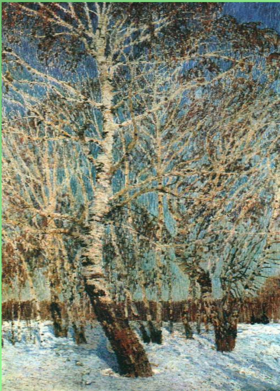
Репродукция картины И.Грабаря «Февральская лазурь»