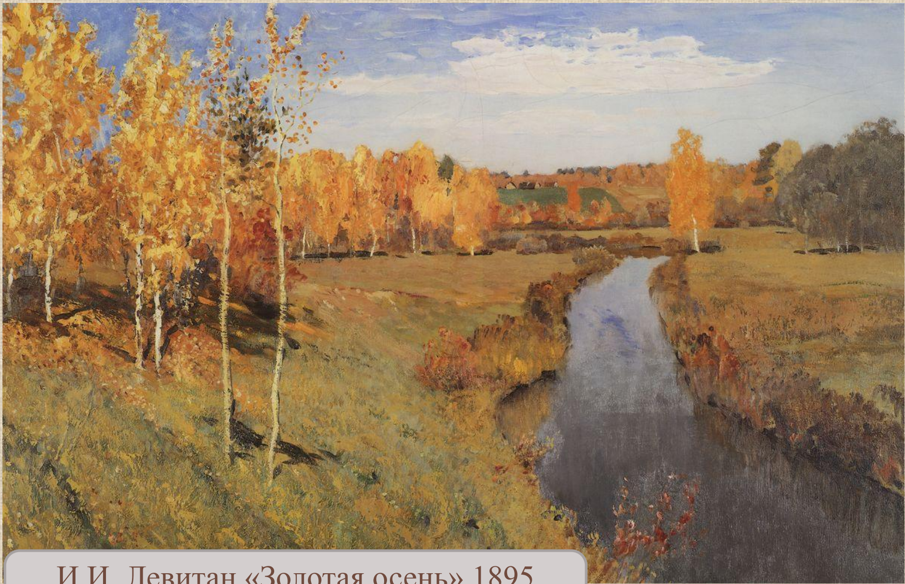
И.И. Левитан «Золотая осень». 1895 Холст, масло. 82х126 см