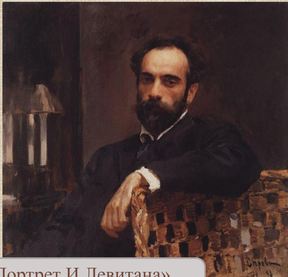
В. Серов «Портрет И.Левитана». 1893 Холст, масло. 82х86 см