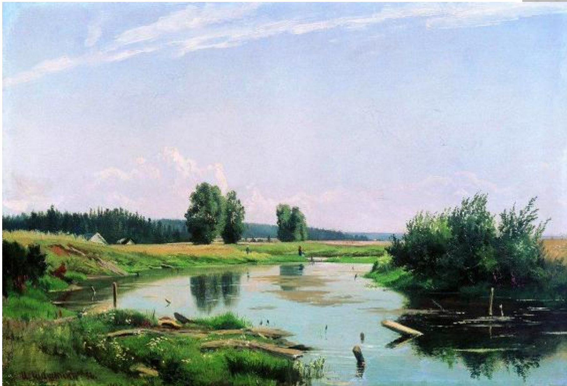
И.ШИШКИН ПЕЙЗАЖ С ОЗЕРОМ