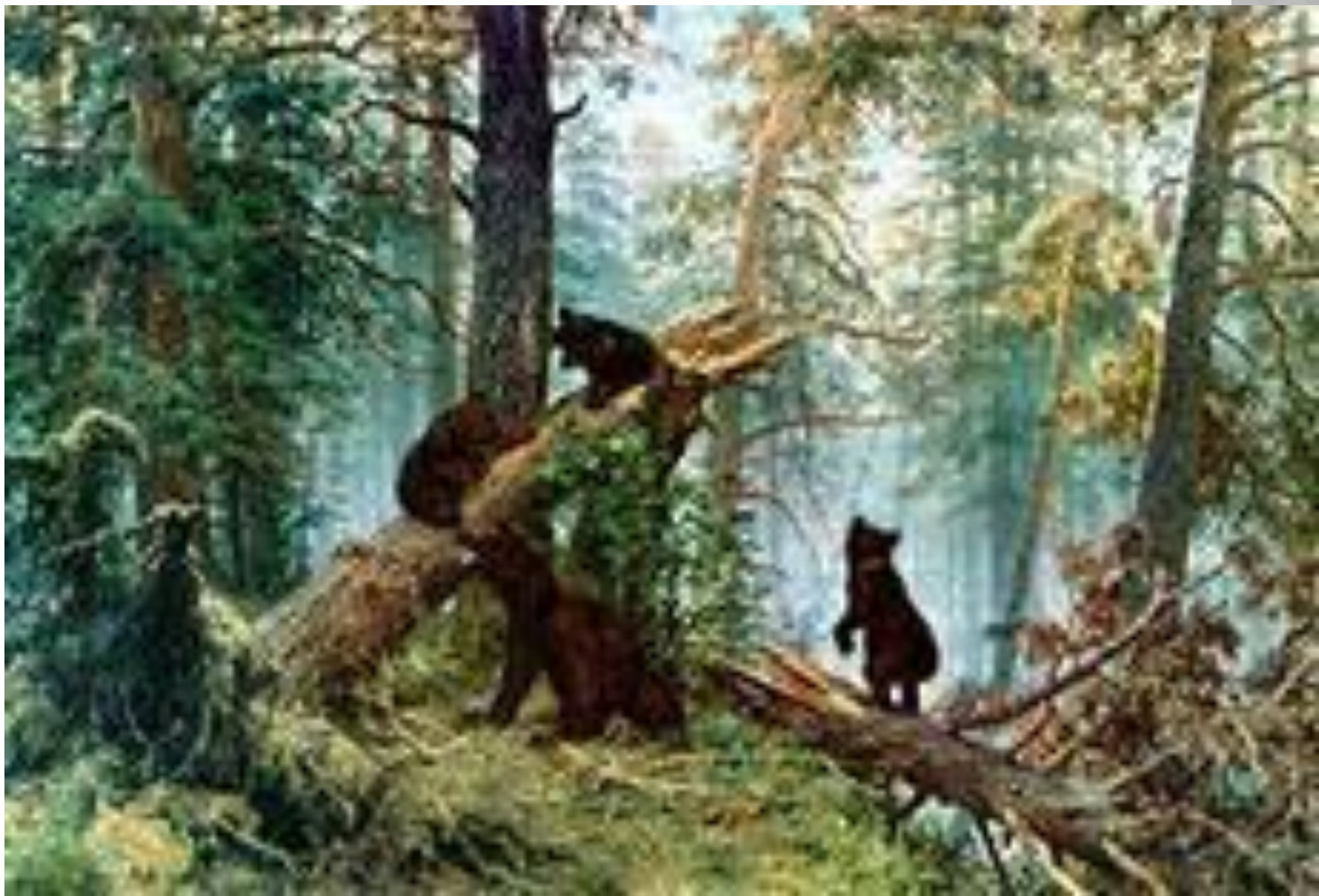
И. ШИШКИН «УТРО В СОСНОВОМ ЛЕСУ»