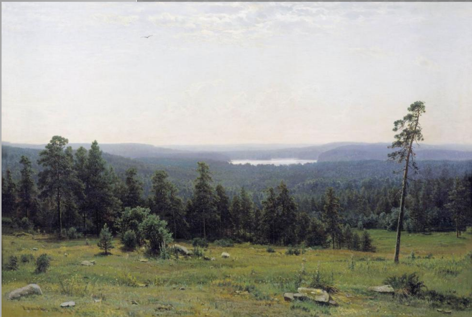
И. Шишкин «Лесные дали»