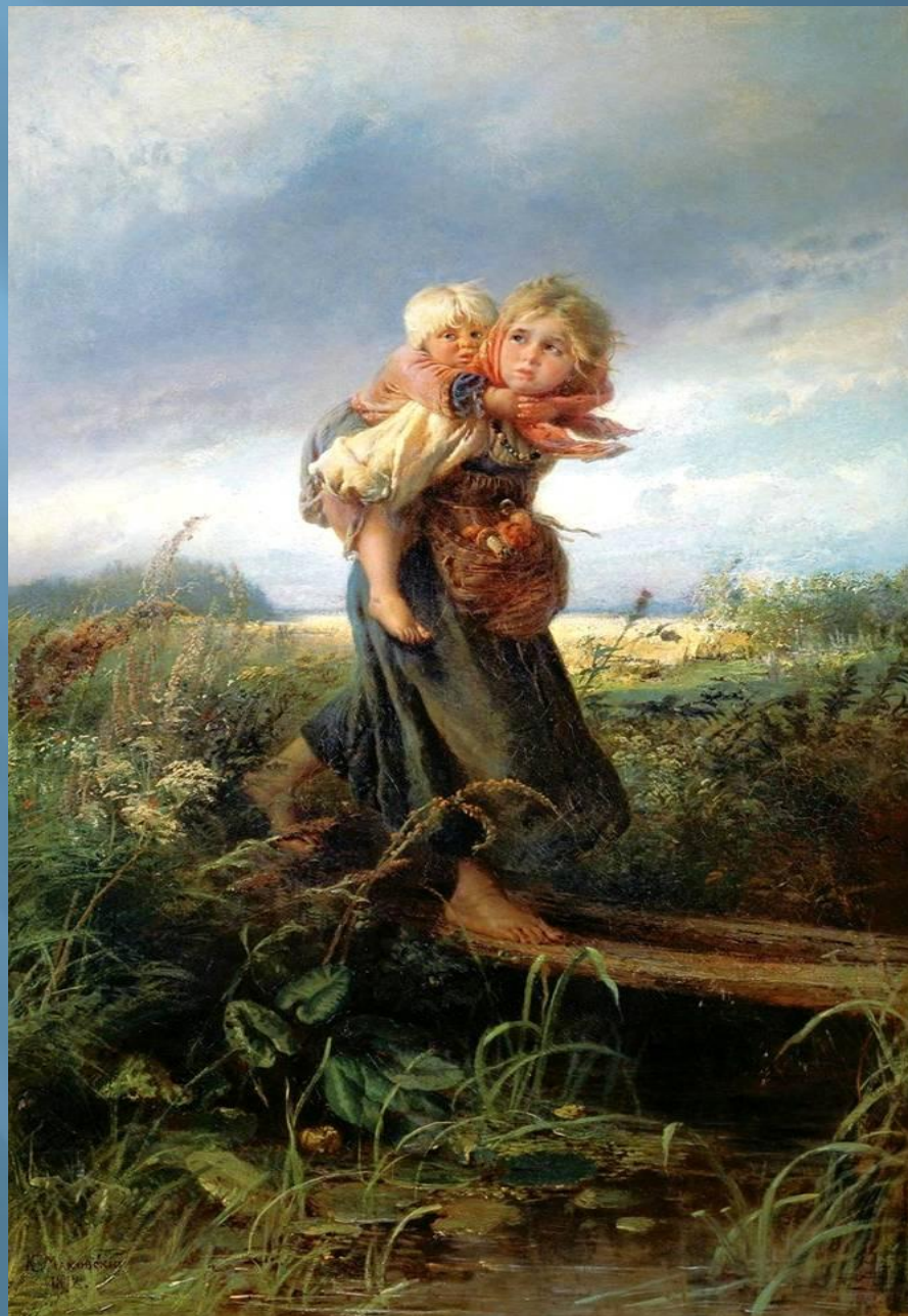
Картина Константина Егоровича Маковского «Дети, бегущие от грозы».