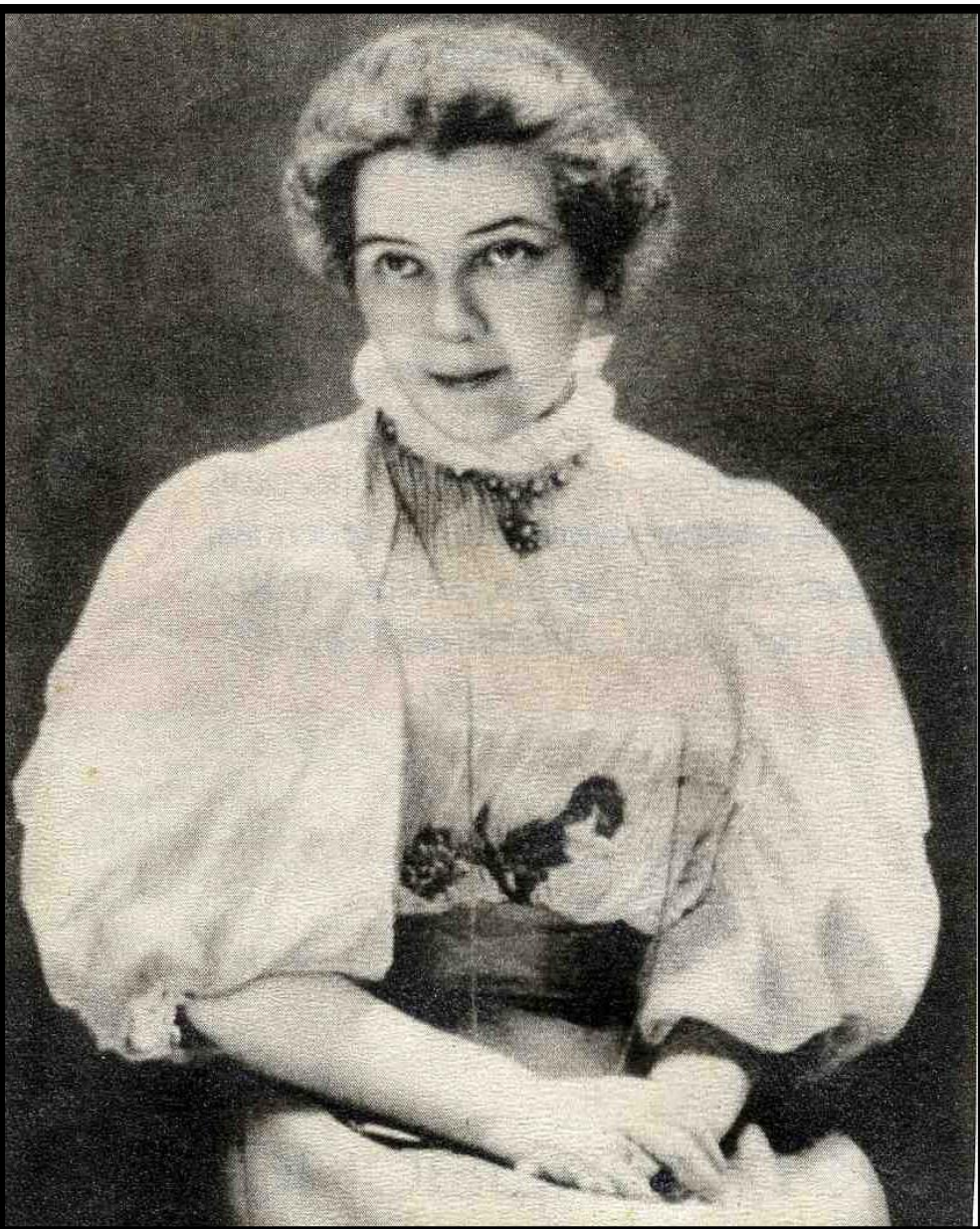
Надежда Ивановна Забела –Врубель 1896 год