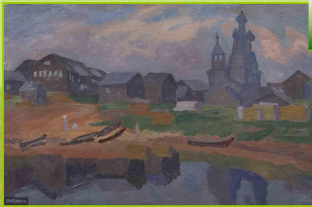
Деревня Кимжа. Худ. В.Е. Попков

«Стало ясно, что так просто от Мезени мне не уйти. Где-то самое дорогое в моей прошлой жизни живёт сейчас там... И на следующий год — опять я в тех краях, уже зная и предчувствуя, что мне нужно».