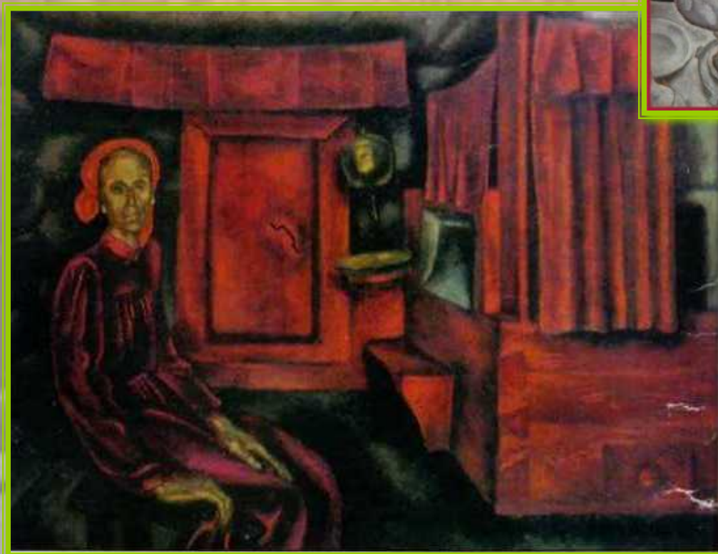
Старость. Худ. В.Е.Попков.