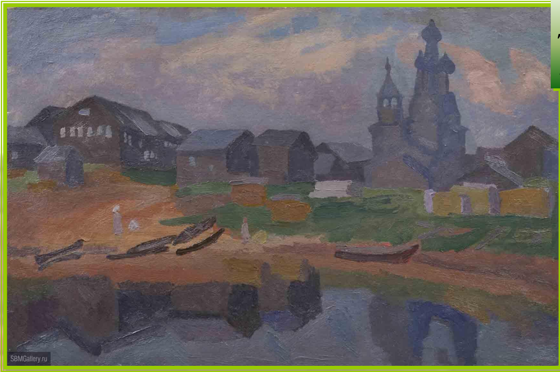
Деревня Кимжа. Худ. В.Е. Попков

«Стало ясно, что так просто от Мезени мне не уйти. Где-то самое дорогое в моей прошлой жизни живёт сейчас там... И на следующий год — опять я в тех краях, уже зная и предчувствуя, что мне нужно».