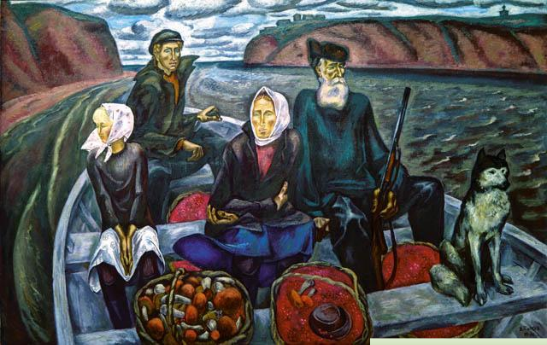
Сентябрь на Мезени. Худ. В.Е. Попков.