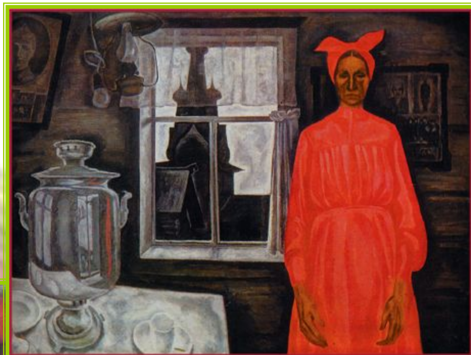
Одна. Худ. В.Е.Попков

«Север не терпит фальши, он весь на ладони»