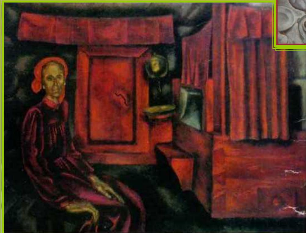
Старость. Худ. В.Е.Попков.