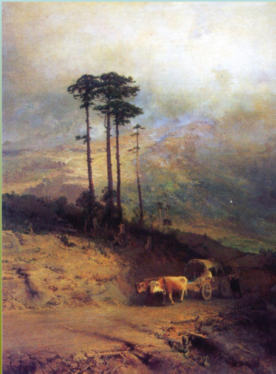
«В крымских горах» (1873)