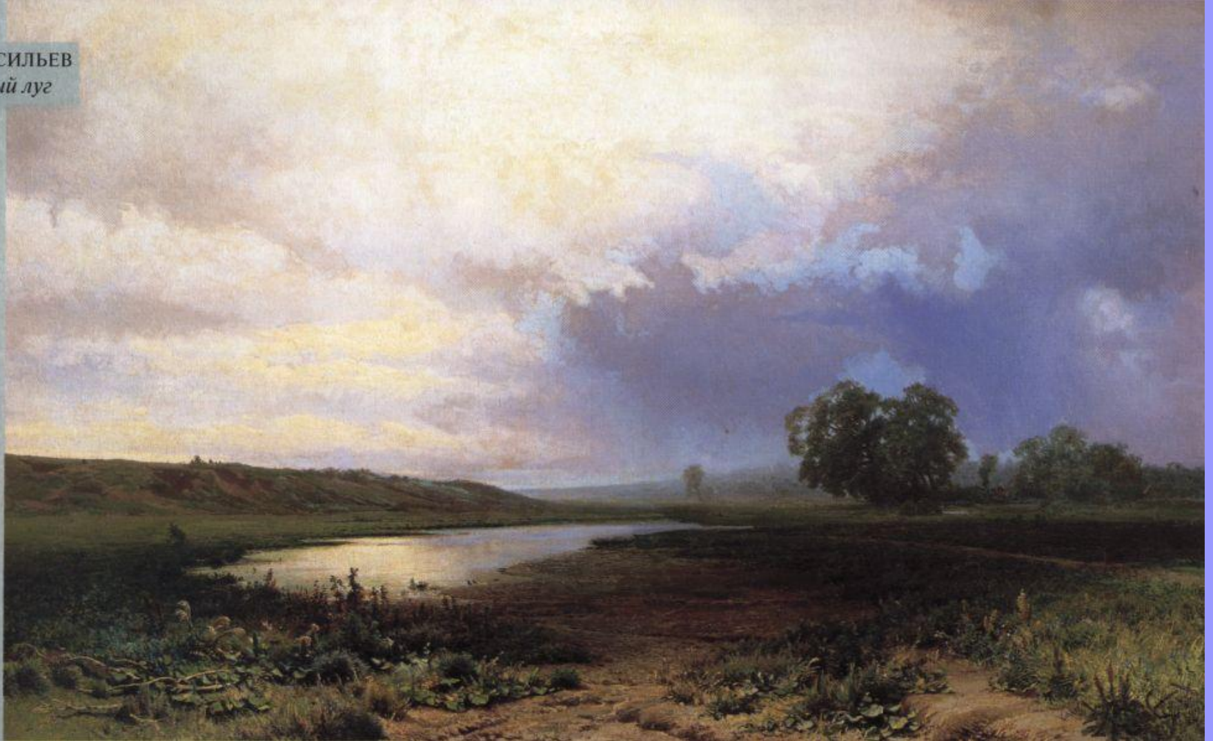
Ф. ВАСИЛЬЕВ Мокрый луг

«Нет у нас пейзажиста-поэта в настоящем смысле этого слова, и если кто может и должен им быть, то это только Васильев»