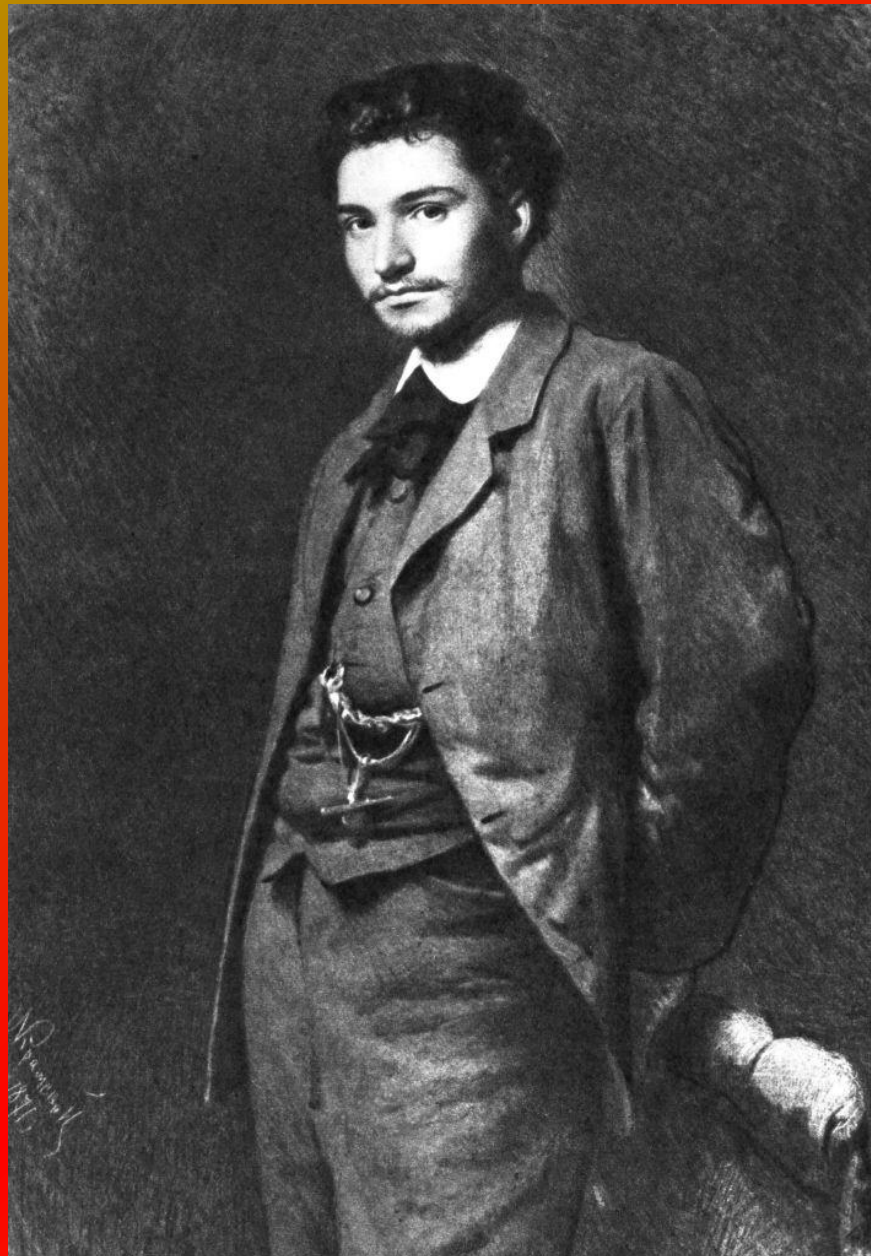
Крамской И.Н. Портрет Ф.А.Васильева