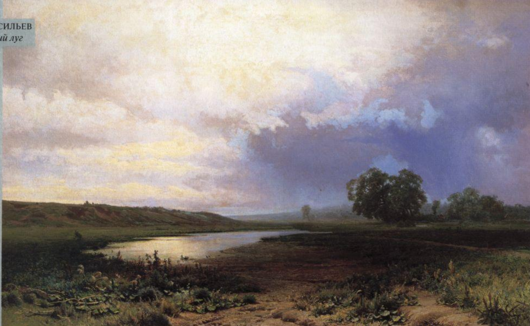
Ф. ВАСИЛЬЕВ Мокрый луг

«Нет у нас пейзажиста-поэта в настоящем смысле этого слова, и если кто может и должен им быть, то это только Васильев»