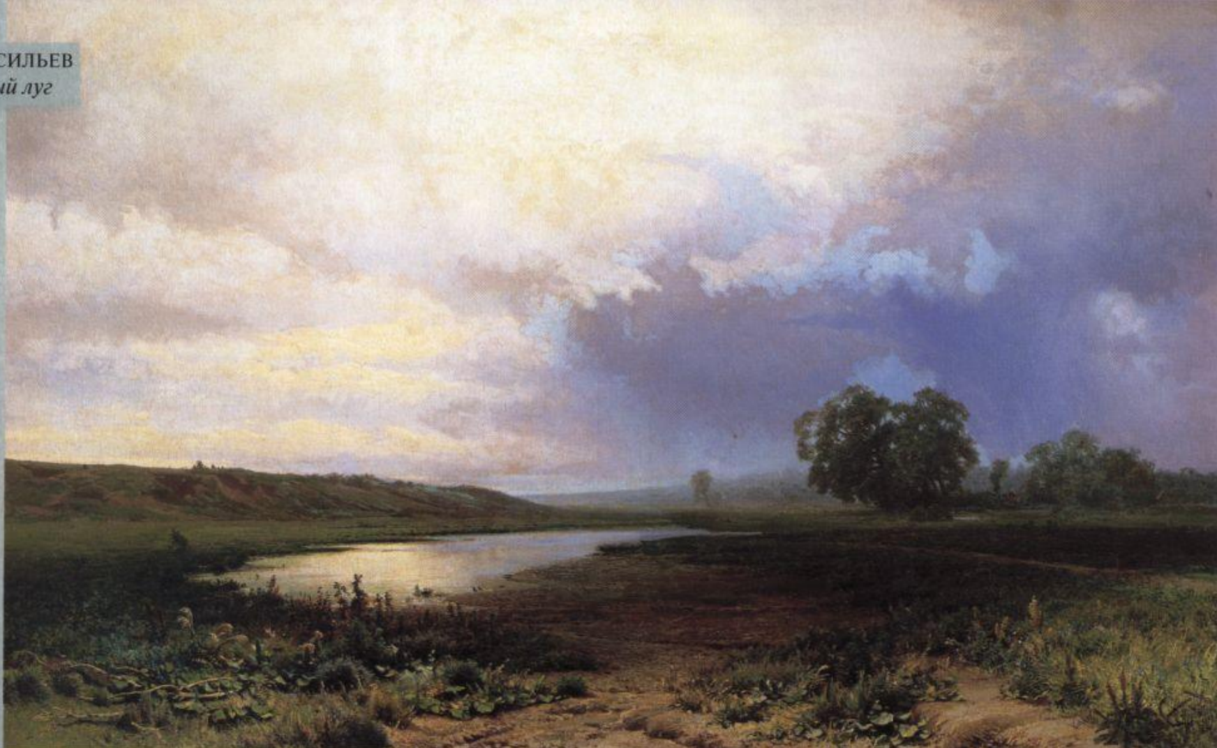
Ф. ВАСИЛЬЕВ Мокрый луг

«Нет у нас пейзажиста-поэта в настоящем смысле этого слова, и если кто может и должен им быть, то это только Васильев»