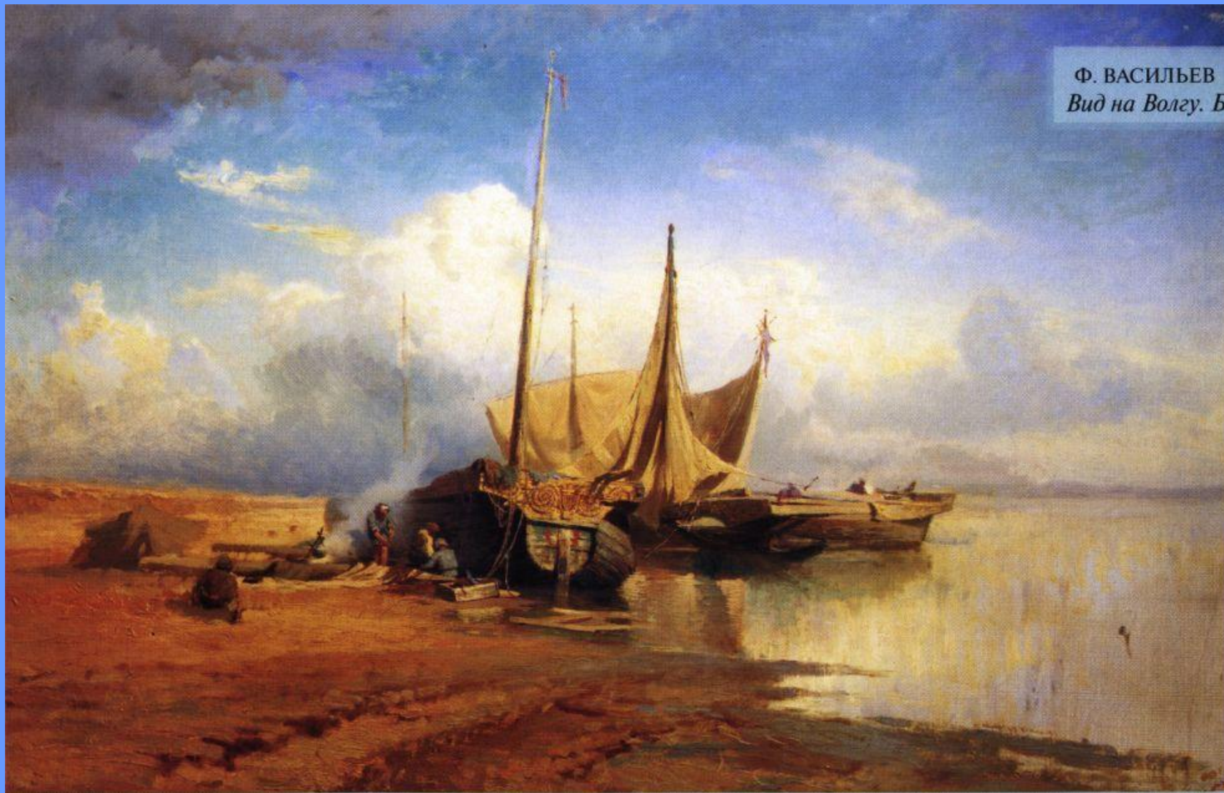
Ф. ВАСИЛЬЕВ Вид на Волгу. Барки