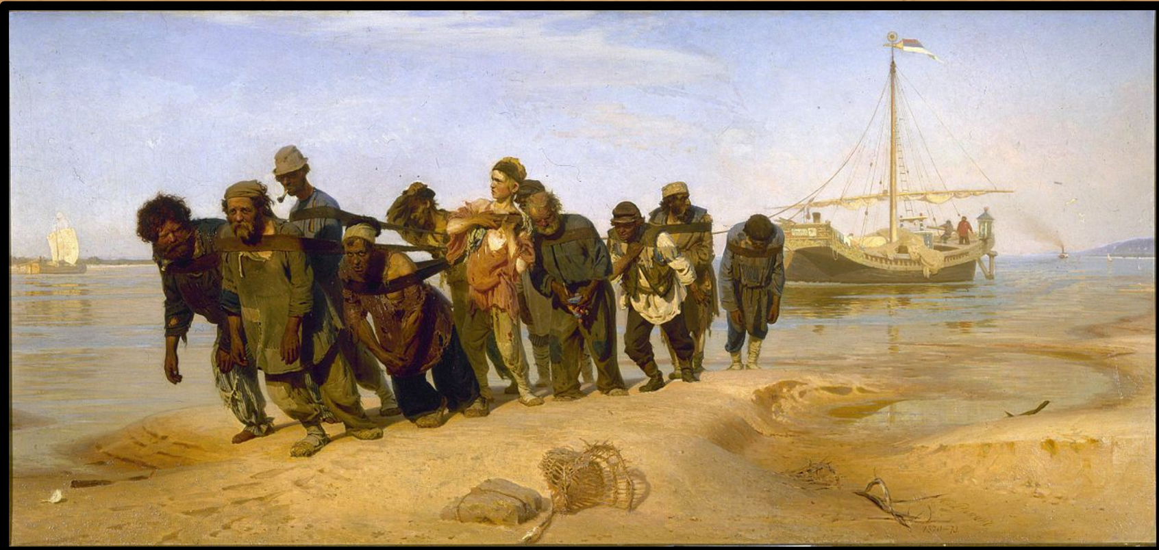
«Бурлаки на Волге»