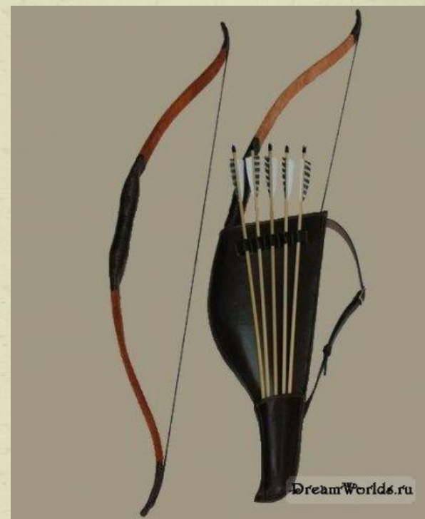
Лук. Колчан со стрелами