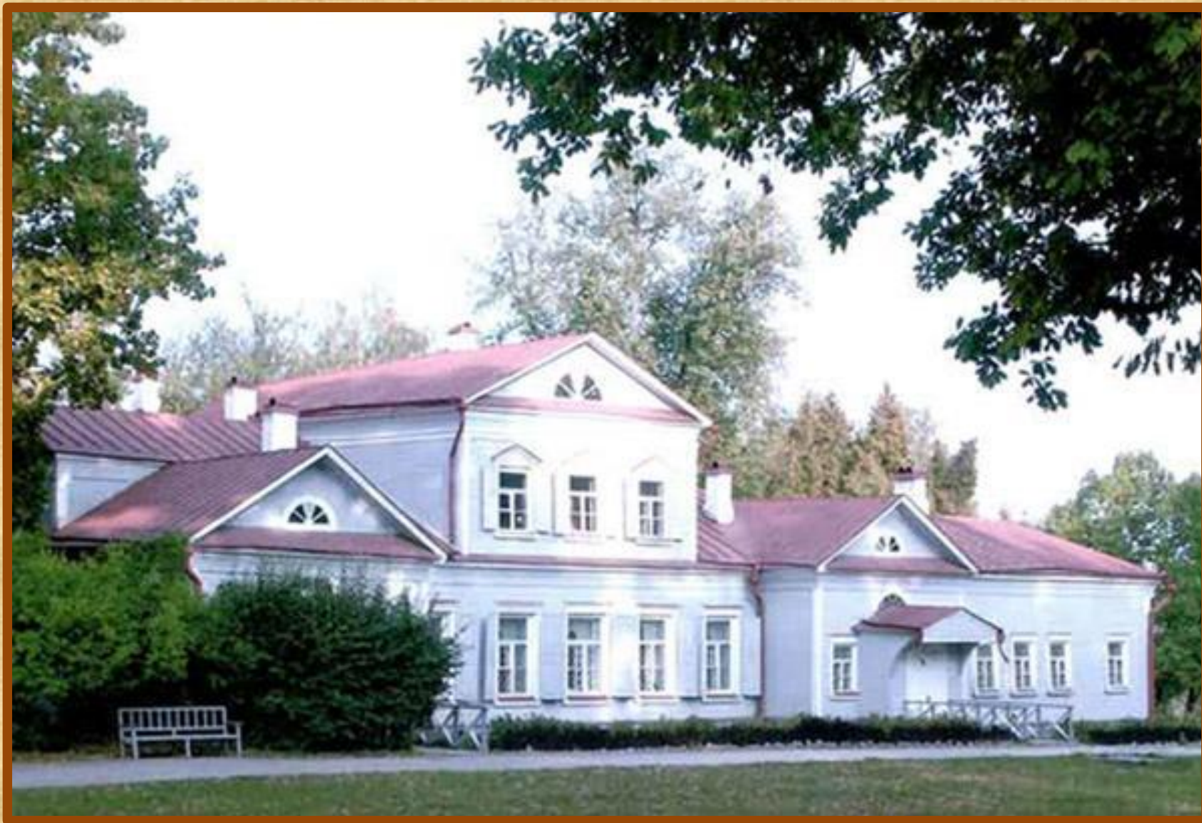
Музей-усадьба в Абрамцево