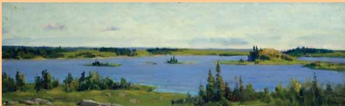
«Пейзаж с видом на реку»