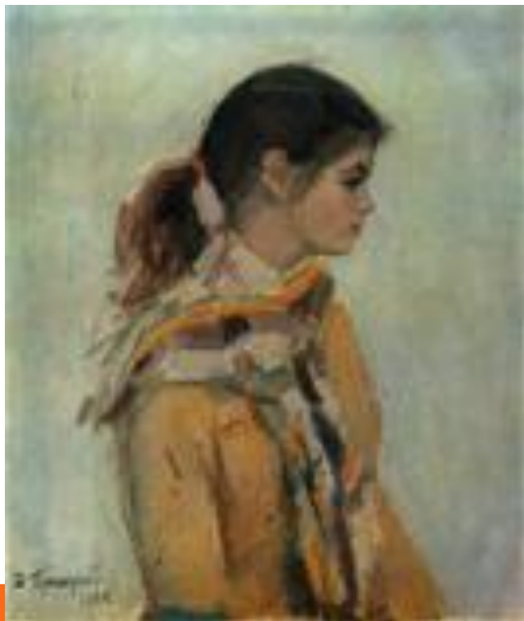
ДЕВОЧКА С ЯБЛОКОМ