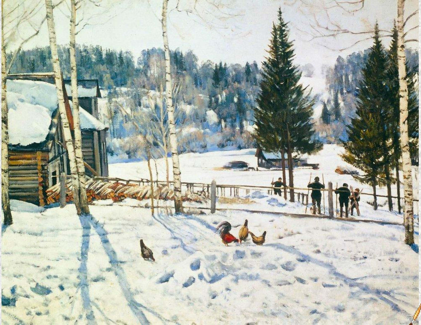
«Конец зимы. Полдень. Лигачево»