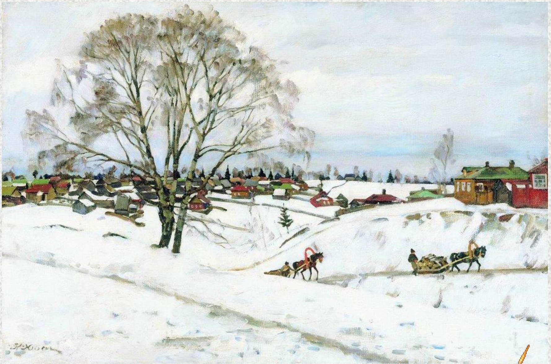
«Зима. Черные березы. Сергиев Посад»