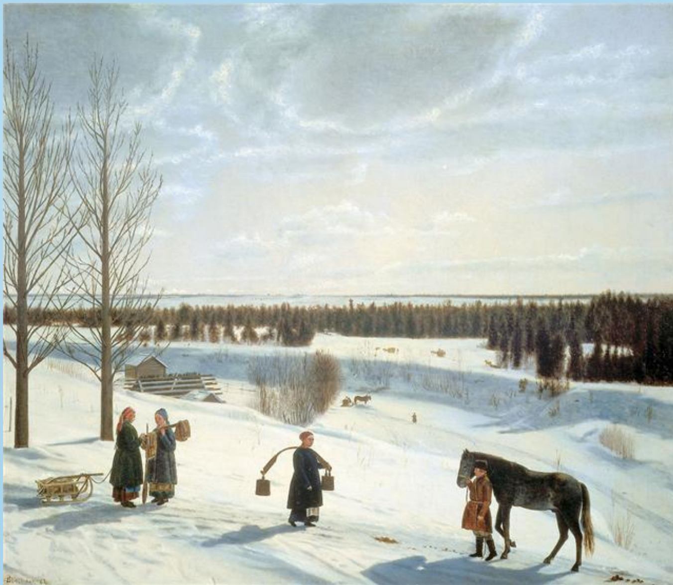
Коровин. Зимний пейзаж