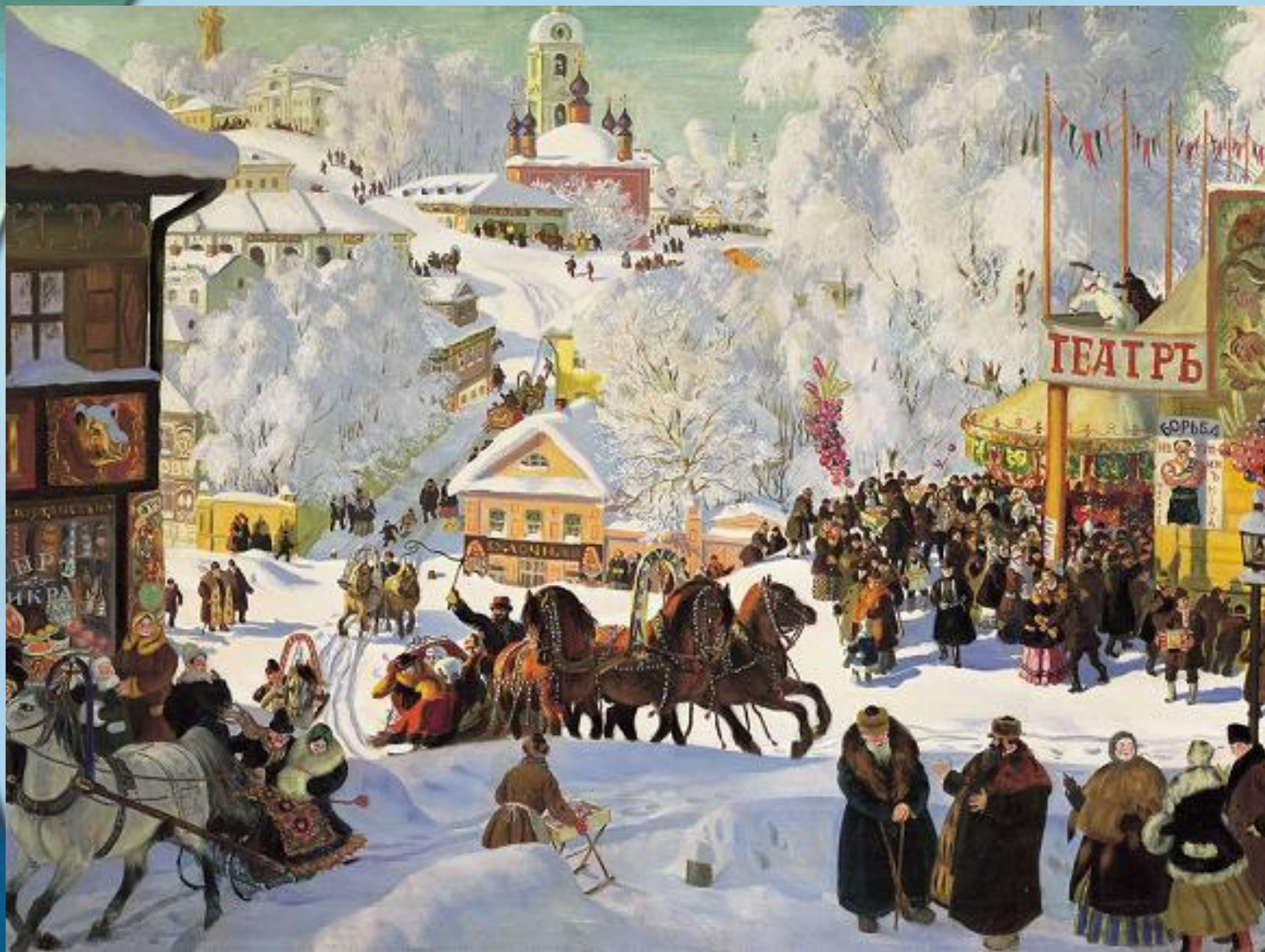
Кустодиев. Масленичное катание.